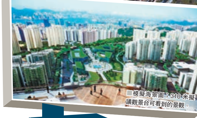
▲安達臣道7幅用地合共可供應6,710個單位，預計可容納18,960人口居住。資料圖片