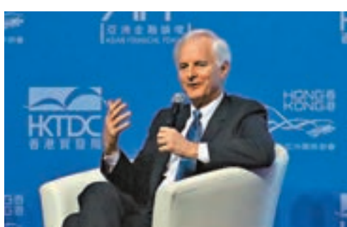
國泰航空主席史樂山相信，供應鏈不會在短時間內出現極大變化。

渣打銀行大中華及北亞地區行政總裁洪丕正亦認為，本港正迎來新機遇。他解釋，料未來10年，10大消費國中有7個會在亞洲，包括中國、日本、韓國、印度等，令亞洲將成為全球主要消費市場，而本港角色將由以往的東西貿易走廊變成南北貿易走廊，並使用更多人民幣進行交易。