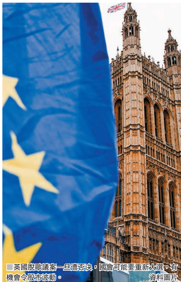
英國脫歐議案一旦遭否決，國會可能要重新大選，有機會令股市波動。

香港文匯報訊（記者 周紹基）內地本周一公佈的出口數據不符預期，反而令市場憧憬中央加快推出刺激經濟政策，港股昨日急升逾500點，一口氣收復周一跌幅。恒指大升532點報26,830點，見1個月高位，成交892億元。三大部委雲集齊發聲撐經濟，具政策概念的5G及建築股受追捧。不過，英國議會將投票表決「脫歐」議案，成為市場的不明朗因素。