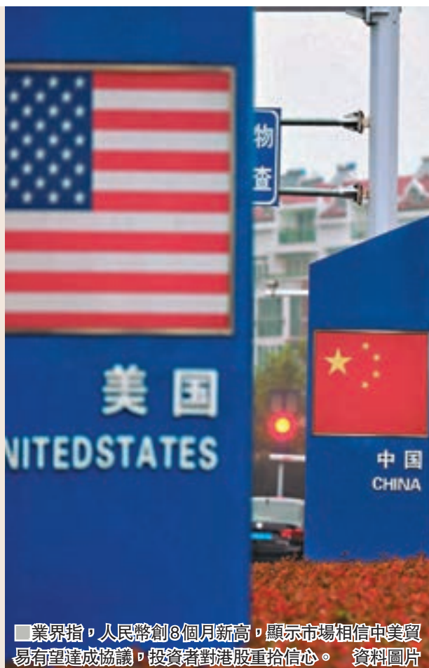
業界指，人民幣創8個月新高，顯示市場相信中美貿易有望達成協議，投資者對港股重拾信心。