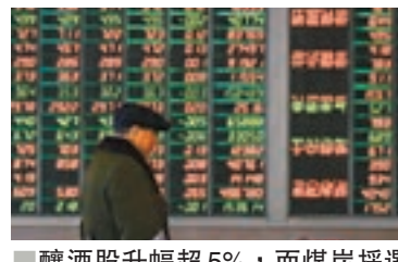
釀酒股升幅超5%，而煤炭採選股則跌近0.7%。

昨早滬指高開0.06%，但深指卻低開0.07%。滬指盤中一度翻綠，低見2,532點，之後轉升，大市持續上揚。截至收市，滬報2,570點，漲34.57點或1.36%；深指報7,547點，漲138.15點或1.86%；創指報1,266點，漲20.27點或1.63%。兩市共成交3,196億元，較周一放大逾300億元。