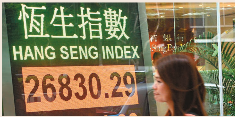
恒指昨日創逾一個月收市高位。當中，瑞聲是表現最好藍籌股，升5.148%。