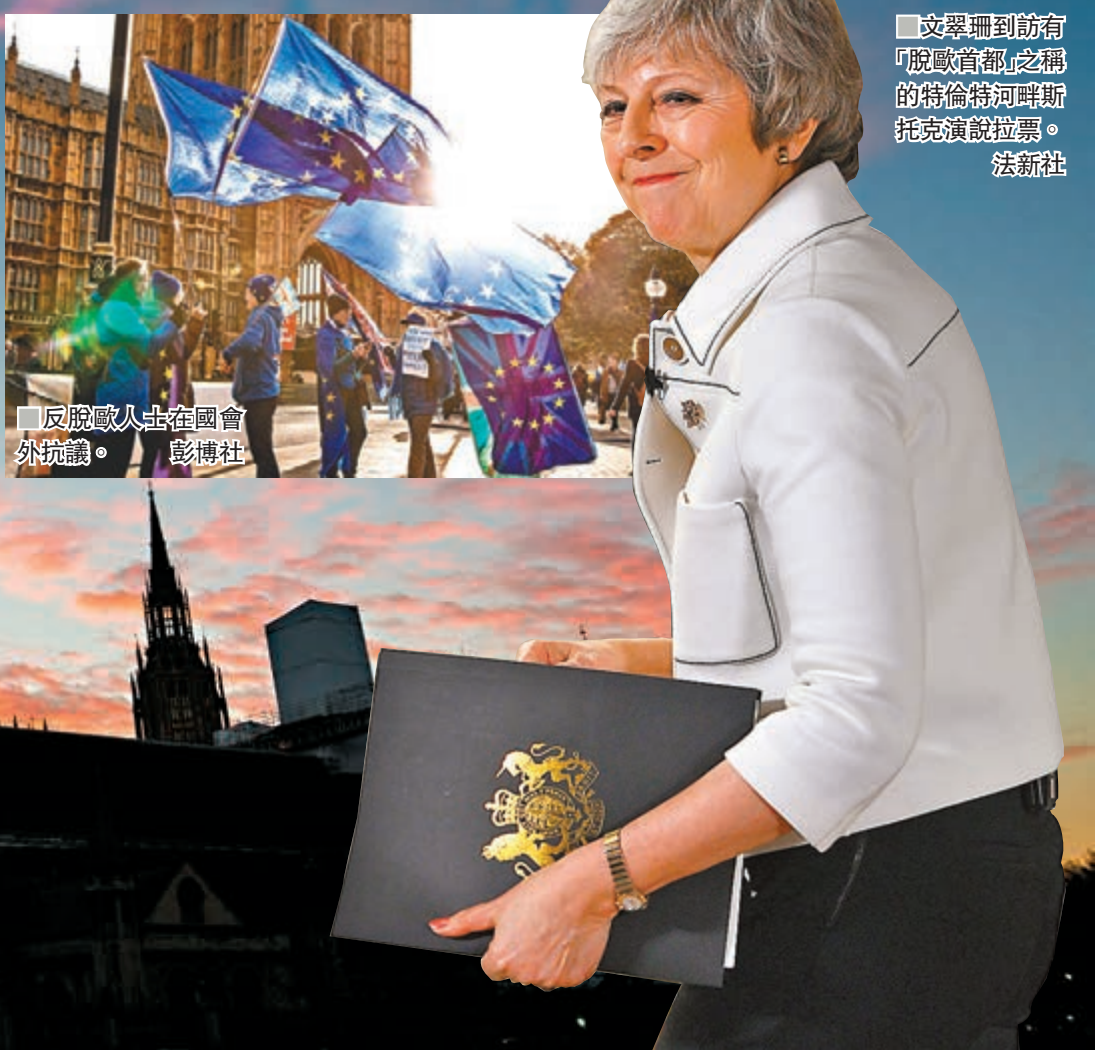
文翠珊到訪有「脫歐首都」之稱的特倫特河畔斯托克演說拉票。

英國國會下議院今日會表決首相文翠珊與歐盟達成的脫歐協議，面對協議很大機會被否決，文翠珊昨日四出奔走盡最後機會拉票，歐盟亦同時作出更多保證，表示將致力避免啟動北愛爾蘭後備方案，希望藉此說服英國議員支持協議。文翠珊形容脫歐處於危險階段，警告相比於無協議脫歐，英國無法脫歐的機會更大，又指如果英國最終無法脫歐，可能重創國民對民主制度的信心，呼籲議員為國家利益贊成協議。對於有報道指歐盟願意將脫歐限期延遲至7月，文翠珊表示不認為英國政府應該押後脫歐，但未有完全排除這個可能性。