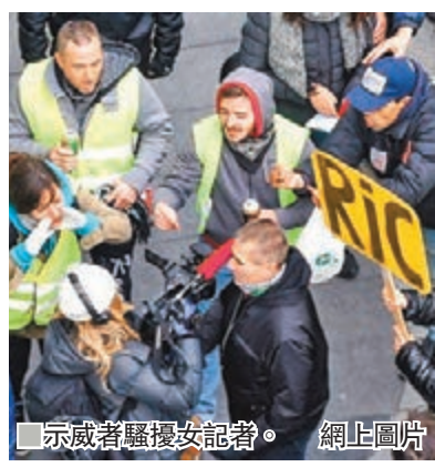
示威者騷擾女記者。