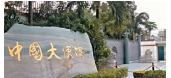
中國駐泰國大使館。網上圖片