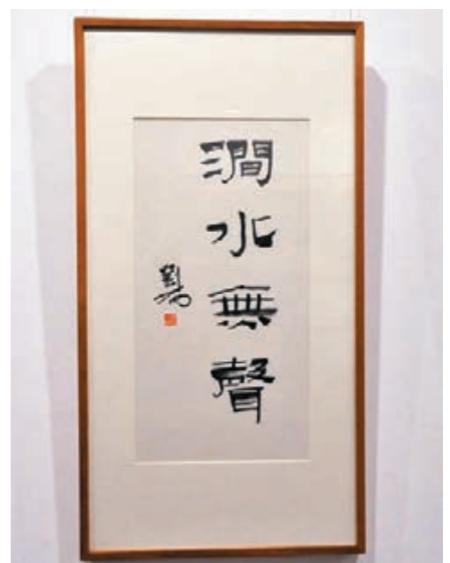
「潤水無聲」會員書畫篆刻開展幕。