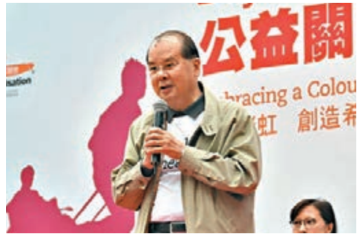
■張建宗昨出席ACCA公益關愛日2019開幕典禮。