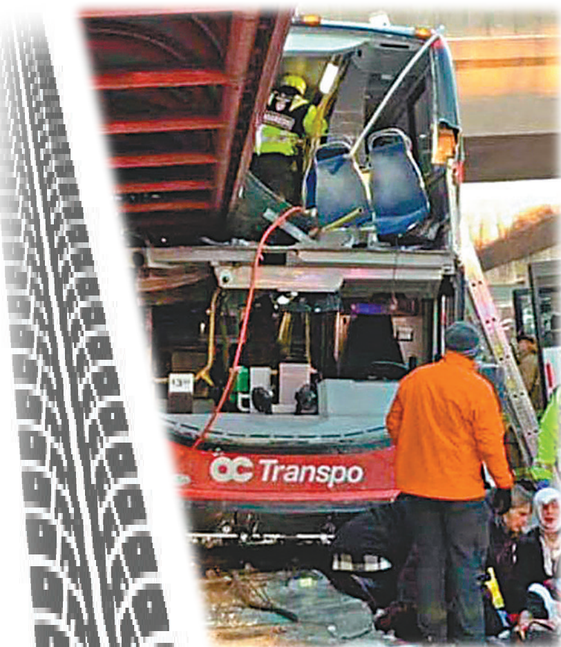
巴士上層有6至7排座位被鏟走。

事發於當地時間前日下午3時50分(香港時間昨日凌晨4時50分)，渥太華卡爾頓交通局一輛269號線的雙層巴士，駛入渥太華市中心以西的韋斯布羅車站時，失控撞向車站上蓋，車頭嚴重損毀，車站上蓋陷入巴士車身，巴士上層右方有6至7排座位被鏟走，部分乘客被掀翻的座椅壓着。