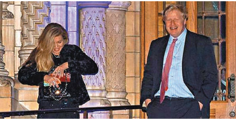
約翰遜(右)與女友西蒙茲。

居於希臘的英國僑民威克斯向英媒透露，他目睹約翰遜與西蒙茲本月3日在希臘一間餐廳用膳，形容約翰遜當時衣着凌亂，而且沒剃鬚子，女方則穿着得