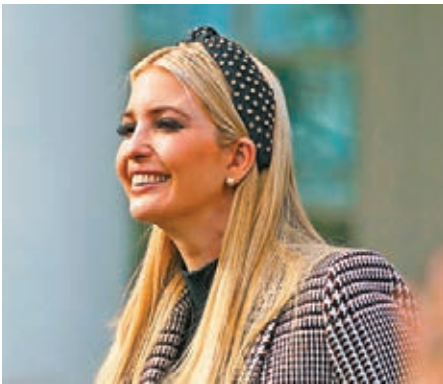
伊萬卡或接任世界銀行行長。

氣候變化和有關中國「一帶一路」的項目提供融資，並同時提出多項大型改革。雖然世銀行長過往皆由美國提名出任，但金墾在2012年參選便曾面對激烈競爭，世銀日前表示，行長遴選過程將是「公開、用人唯才和具透明度」，意味美國的人選未必篤定出任。 ■綜合報道