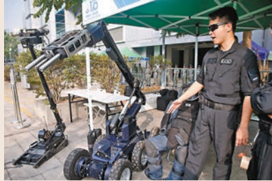
會場展出先進裝備。