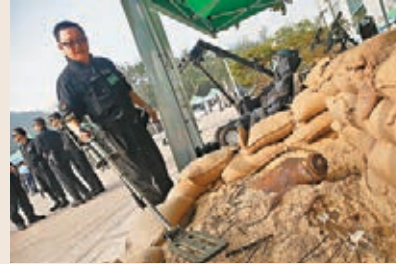
市民可試用歐製的金屬探測器。