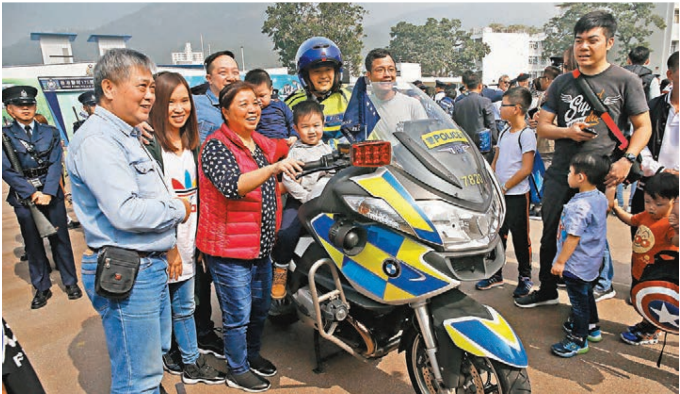
市民一家大細體驗撞警車。

她希望香港市民珍惜香港這一支歷史悠久、表現卓越的警隊，亦希望警隊在未來的日子以專業的精神繼續「守護香港，服務社群」。