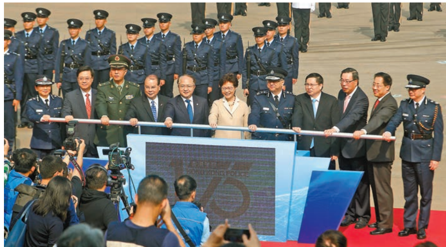
嘉賓主持開幕禮。左起：趙慧賢、李家超、鄭國躍、張建宗、王志民、林鄭月娥、盧偉聰、宋如安、梁君彥、楊建平、鄧炳強。

香港文匯報訊（記者 殷翔、文森）為慶祝警隊成立175周年，「香港警隊175周年大匯演暨警民同樂日」昨日揭開序幕。主禮嘉賓行政長官林鄭月娥在開幕禮上致辭時，感謝警隊多年來盡忠職守，維持良好治安，讓香港蓬勃發展，而警隊的文明專業令香港成為全球最安全城市之一，也是她對外推廣的金名片。警務處處長盧偉聰表示，警隊所有人員今後會繼續團結一致，守護香港，與廣大市民共建和諧社會。