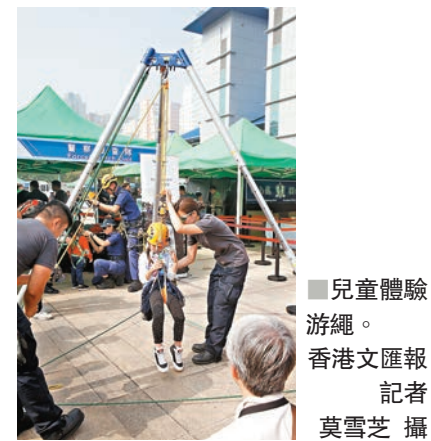
兒童體驗玩繩。

此外，為履行社會責任，活動更特邀多間社會企業提供服務及設立銷售攤位，香港關顧自閉聯盟更會於現場舉行畫展，展示自閉人士的藝術才華。