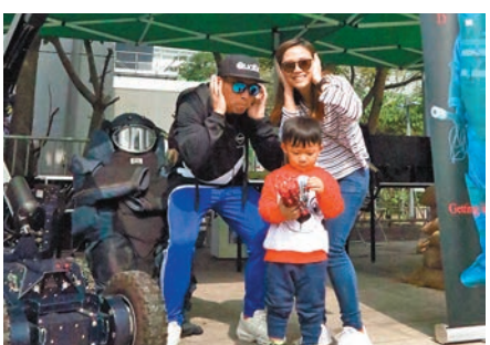
余生一家