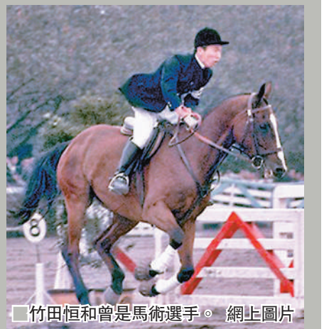
竹田恒和曾是馬術選手。