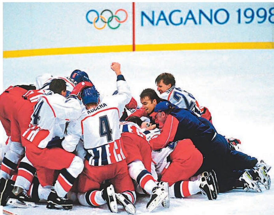
日本被質疑在申辦1998年冬奧時行賄。