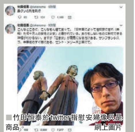
竹田恒泰於twitter指慰安婦像只是商品。