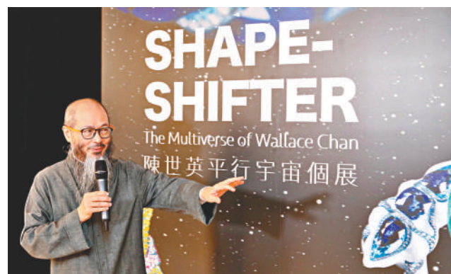
■佳士得公開展出陳世英，超過80件獨特珍稀作品。