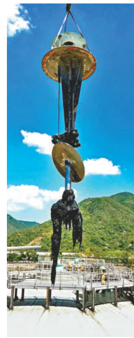
■清理污泥消化缸內固體垃圾的S形掛鉤「泥鯁釣魚機」。