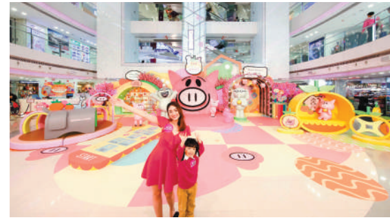
■有商場化身以小豬為主題新春遊樂園。

市民亦可參與商場活動或消費滿指定金額，將《Elephant and Piggie》的相關賀年精品帶回家，包括利是封、賀年揮春及保溫袋。