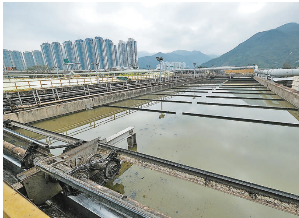
■佔地28公頃沙田污水處理廠自1982年開始運作，是全港最大的二級污水處理廠，為沙田及馬鞍山區60萬市民提供污水處理服務。