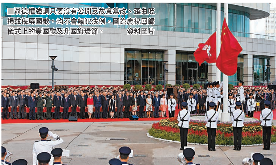
聶德權強調只要沒有公開及故意篡改、歪曲貶損或侮辱國歌，均不會觸犯法例。圖為慶祝回歸儀式上的奏國歌及升旗環繞節。資料圖片

香港文匯報訊（記者 鄭治祖）《國歌條例草案》今日刊憲，並將於本月底提交到立法會進行首讀和二讀辯論，正式啟動立法程序。政制及內地事務局局長聶德權昨日接連到不同電台向公眾解釋有關草案，包括強調將檢控時限延長至最多兩年，是為了應對人數較多或涉及海外IP的罪行，讓警方有合理時間去調查和搜證。他又釐清市民對「誤墮法網」的擔心，強調只要沒有公開及故意篡改、歪曲貶損或侮辱國歌，不論是唱歌走音、唱不好普通話、一時沒有為意到國歌正在演奏，均不會觸犯法例。