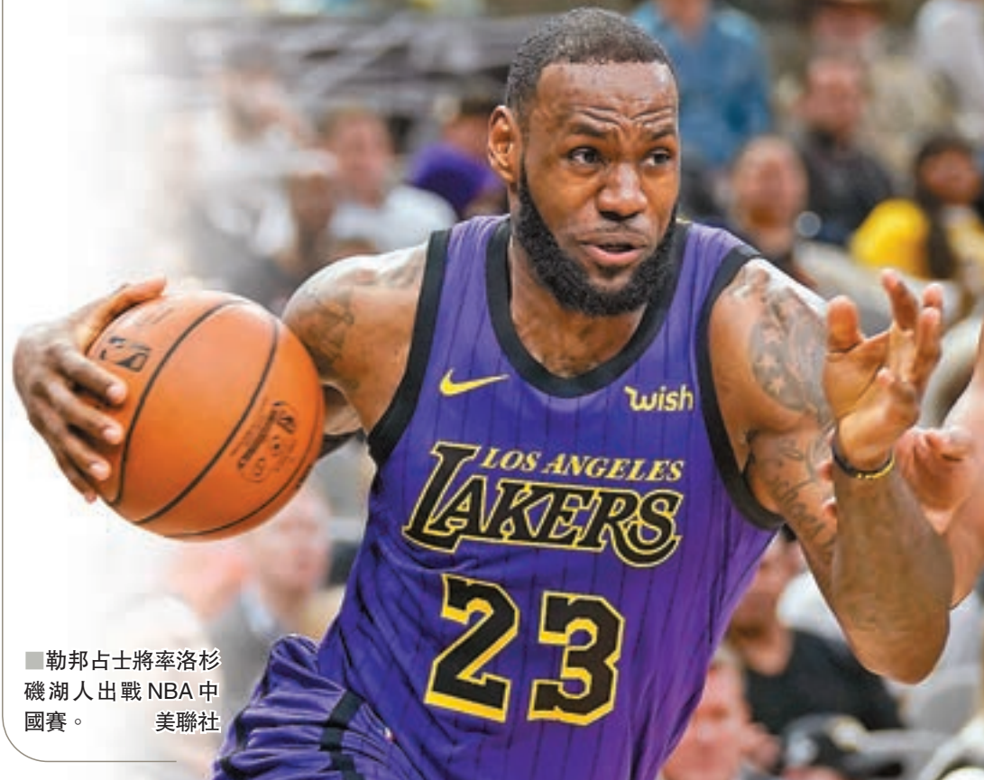
■勒邦占士將率洛杉磯湖人出戰NBA中國賽。美聯社