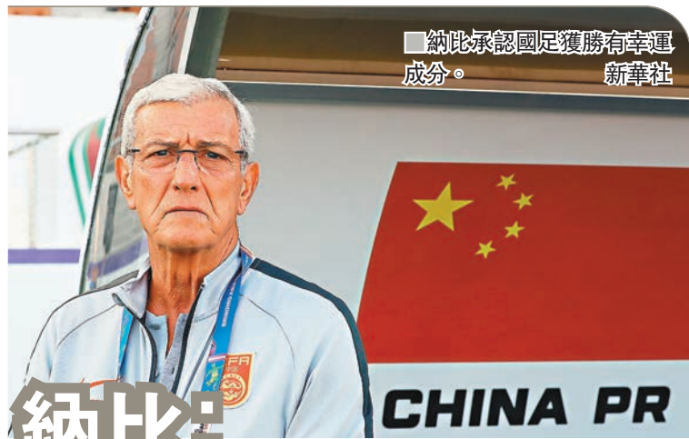
■納比承認國足獲勝有幸運成分。