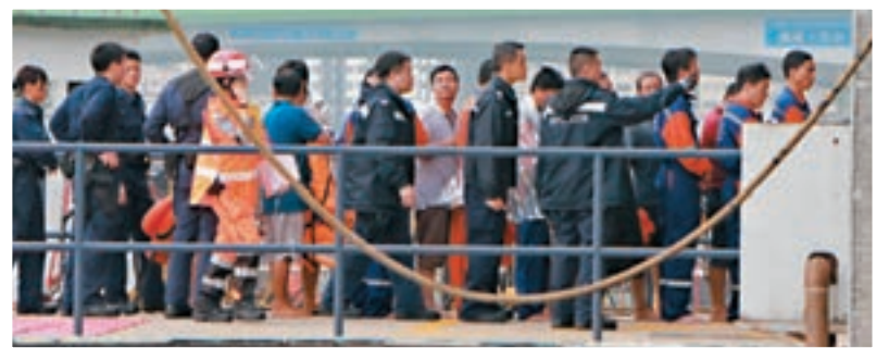
香港文匯報記者 蕭景源