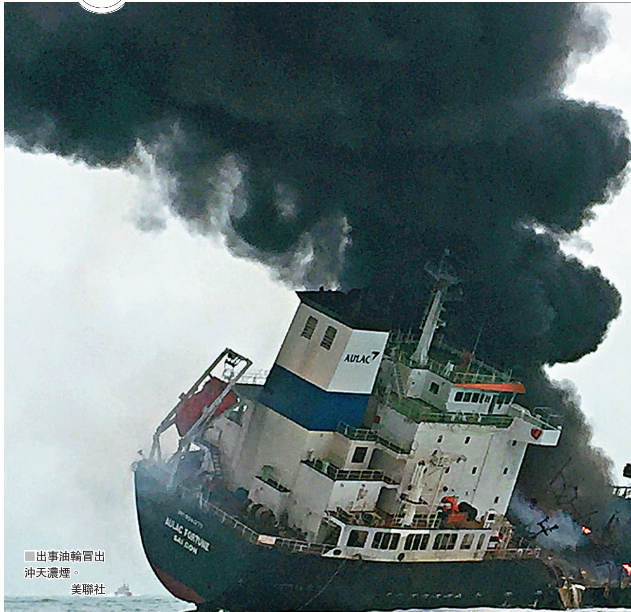
出事的油輪冒出冲天濃煙。