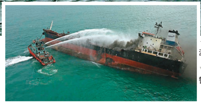
水警消防救滅火。

另一目擊者稱，當時他的油壘剛好經過附近，運油輪的爆炸威力強大，將其壘船的窗也震爛飛脫，其後更目睹油輪上有穿制服的船員跳海逃生，他遂協助將他們救起，其後發現其中一名獲救船員被燒傷，大片頭髮亦被燒焦。