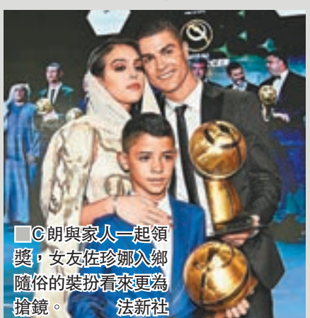
C朗與家人一起領獎，女友佐珍娜入鄉隨俗的裝扮看來更為搶鏡。