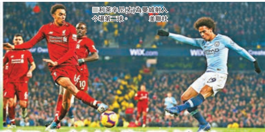
利萊辛尼(右)為曼城射入今場第二球。