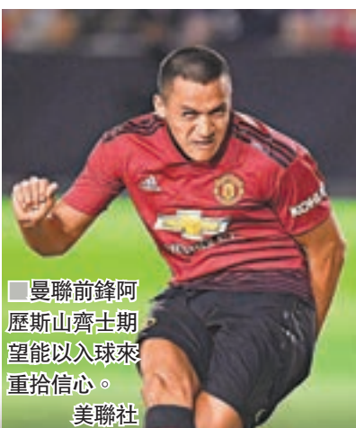
曼聯前鋒阿歷斯山齊士期望能以入球來重拾信心。