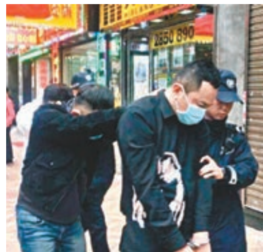
警員開槍案中，3名內地遊客涉6宗罪被捕。