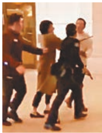
片段所見，警員開槍示警後白衣男子仍不斷撲向他。短片截圖

澳門警察協會昨日發聲明，本會對於襲警行為表示憤怒，認為澳門作為法治的社會，絕不容許任何暴力及破壞社會秩序的行為，本會支持各前線的警員，採取適當有效之示警方式，依法維持治安及社會秩序。 ■香港文匯報記者 蕭景源