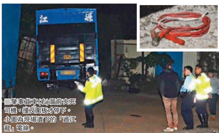
肇事貨車(右)溜前夾死司機，撞毀圍板才停下。小圖為現場遺下的「過江龍」電線。

警方事後在現場檢獲接駁電池用的「過江龍」電線，初步調查後相信事件無可疑，列作工業意外事故，並調查真正肇因。