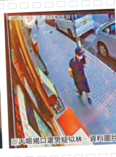
天眼揭口罩男疑似林。資料圖片