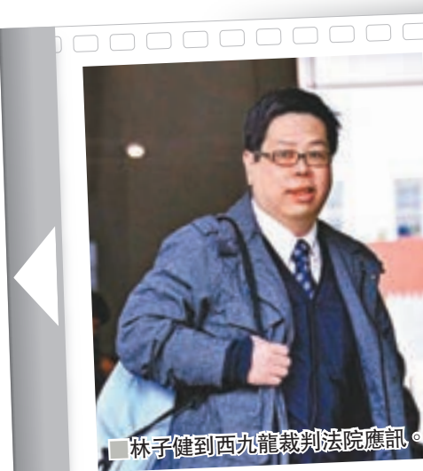
林子健到西九龍裁判法院應訊。

此外，控方亦會將被告於案發後在傳媒的公開評論及訪問呈堂，包括被告在立法會召開的記者會、於facebook的直播、網媒《香港01》與他在石灘的訪問直播、商業電台《在晴朗的一天出發》訪問錄音、香港電台《千禧年代》訪問錄音，以及傳真社的訪問直播。