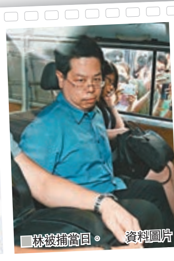
林被捕當日。