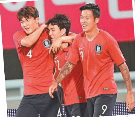
韓國隊是國足分組賽最強對手。

假如國足能夠過關晉級8強，那麼他們將很有可能會遇到沙特、伊拉克、敘利亞或者烏茲別克的阻截。如果能夠再進一步，晉級