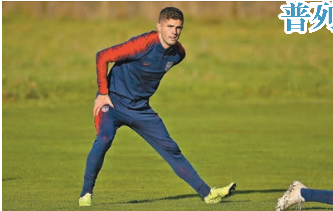
■基斯甸普列錫是美國隊新一代球星。