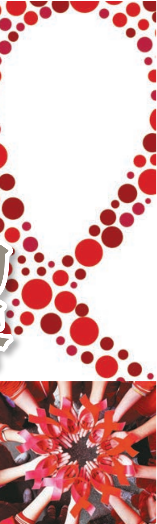
紅絲帶象徵對HIV陽性者及與他們的共同生活者的關懷與接納。資料圖片

之被人們發掘。現階段治療愛滋病毒的目的，以持續盡量降低病毒量為主，確診者一般透過藥物治療維持自身抵抗力所需。