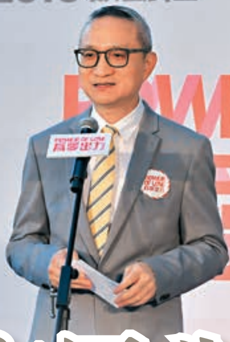
徐德義出席去年的全球同抗愛滋病運動2018啟動禮。