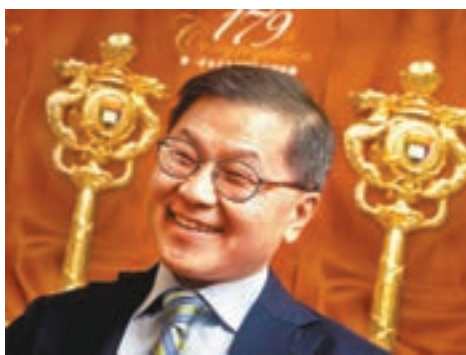
何大一研發出雞尾酒療法後，愛滋病的死亡率已大幅降低。

為提升大眾對愛滋病的了解和關注，衛生署紅絲帶中心籌備了一系列以「為愛出力」為主題的愛滋病宣傳推廣及公眾教育活動，透過社交平台、網絡短片和深入社區的街站等方式接觸市民，讓他們了解及早診斷和治理愛滋病的重要性。