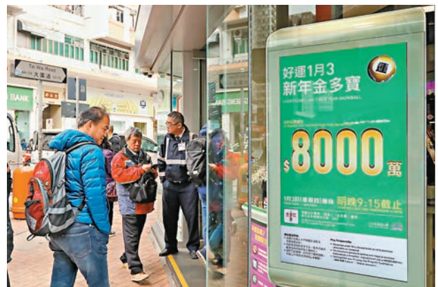
六合彩新年金多寶今晚攞珠，若一注獨中有機會贏走8,000萬港元。

馬會提醒幸運兒，如10元一注的公佈獎金超過500萬元，所有中獎彩票持票人士或經由電話投注服務的中獎人士，包括使用智財卡、1886電話投注自動服務系統等，須於指定時間（公佈攞珠結果後至翌日下午5時）致電馬會熱線1817登記（使用互動投注服務途徑的中獎者除外）；而所有獲中彩票，必須於有關攞珠的日期後起計60天內領取。