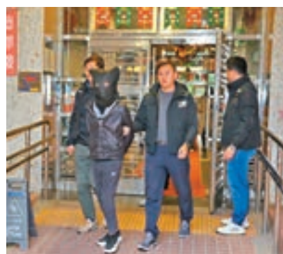
黑幫斬人後燒車案，警方閃電破案拘捕3人，初步涉及黑幫同門內訌尋仇。

香港文匯報訊（記者 蕭景源）前日元旦夜在油麻地警署對開發生的黑幫斬人後燒車案有突破性發展，警方經調查拘捕3名涉案男子閃電破案，初步涉及黑幫同門內訌尋仇；警方行動仍在進行中，不排除有更多人被捕。