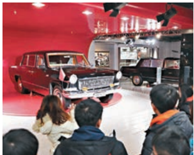
▲港生聽取新中國汽車研發展史。