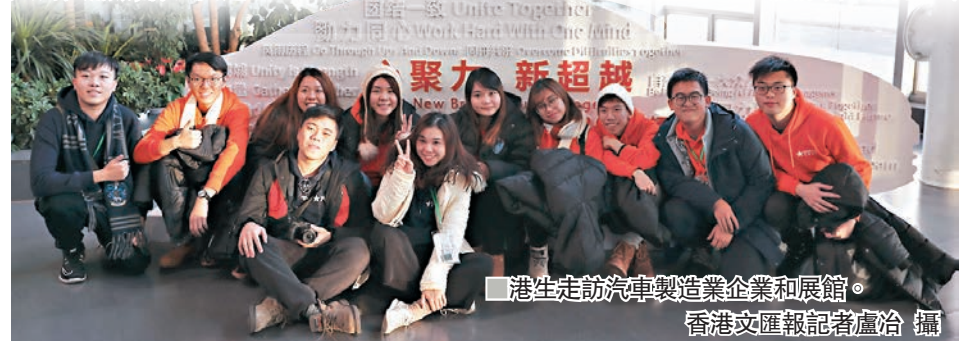
港生走訪汽車製造業企業和展館。