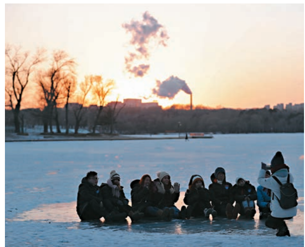
■初次腳踏冰湖。

趕時代進步的精神,還了解到目前新紅旗正在積極推進實施一汽「紅旗小鎮計劃」,以紅旗品牌悠久文化復興為戰略支點,搭建民族品牌創新創業發展平台。