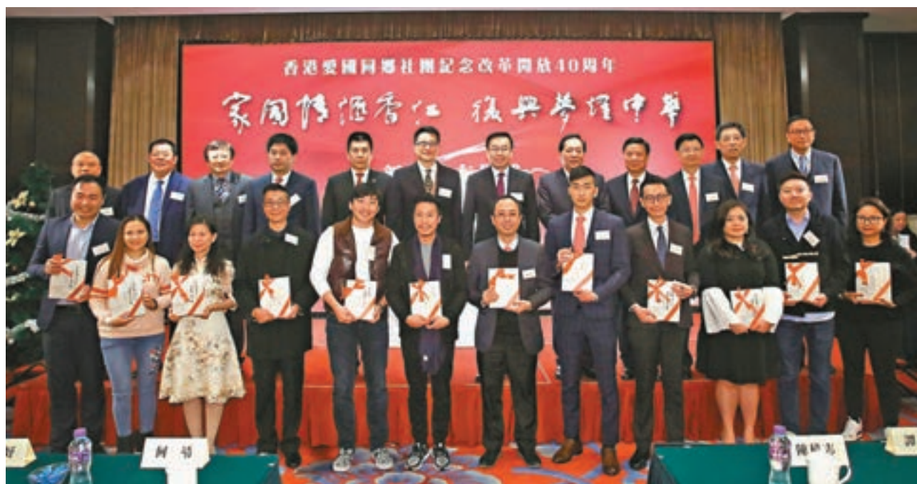
《家國情匯香江 復興夢耀中華》新書發佈會,主禮嘉賓於贈書儀式上與青年代表合影。

來,香港和國家同發展、共繁榮,未來將積極響應中央改革開放再出發的號召,在「一帶一路」倡議和粵港澳大灣區建設中積極參與,務實作為,和祖國人民共擔民族復興的歷史責任,共享祖國繁榮富強的偉大榮光。