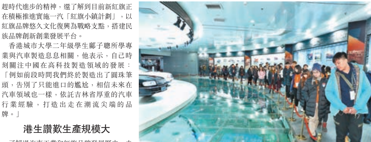
未來之星了解一汽發展歷史、紅旗車的發展歷程。