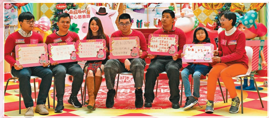
■「香港新希望2019 分享會」昨日舉行，生命鬥士們各自許下新年祝願，希望傳播更多正能量。