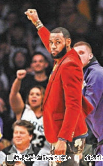
勒邦占士為隊友打氣。

美國職籃(NBA)30日的比賽，當日恰逢勒邦占士的34歲生日，儘管「大帝」因傷缺陣，但洛杉磯湖人眾將還是以121:114主場擊敗帝王，終止2連敗，用勝利給場邊觀戰的大帝送上生日大禮。 兩軍4天內第2次交鋒，上仗帝王憑保丹諾域的絕殺三分險勝117:116。此役帝王在比賽還剩4分30秒時仍以110:103領先，此後湖人眾將接連得分，其中恩格林的三分球幫助湖人以113:110反超，並獲得最終勝利。