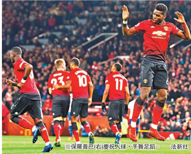
保羅普巴(右)慶祝入球，手舞足蹈。