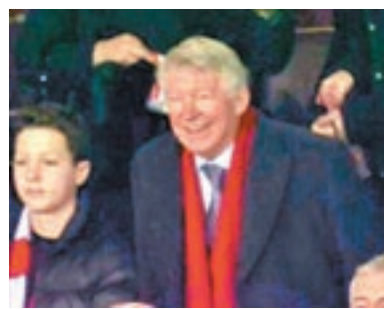
費Sir重現燦爛笑容。