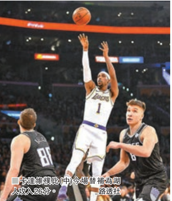
卡達維模比(中)今場替補為湖人攻入28分。