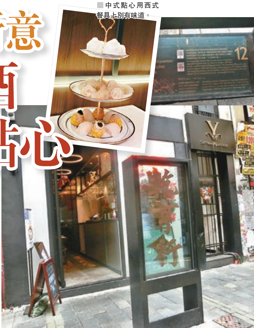
■中式點心用西式 餐具上別有味道。

雖然不是香港居民，你會發現不少九龍人其實對港島區街道不熟悉的。這天跟隨朋友踩上中環士丹頓街13號一間叫興中會餐廳吃午餐，到場後見到店舖前一個「興中會」的地標和歷史簡介，不禁「呀！」一聲，原來是孫中山等革命同仁當年搞革命的組織，興中會總機關設於此，立即興趣大增，餐廳空間不大，擺一行枱，再加個露台而已，容納客人不多。