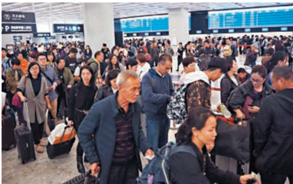
不少內地旅客在聖誕假期期間，乘搭高鐵經西九龍站出入境赴港旅遊。