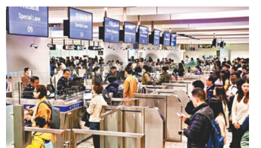
元旦假期首日，西九龍站口岸全天查驗出入境旅客8萬人次。