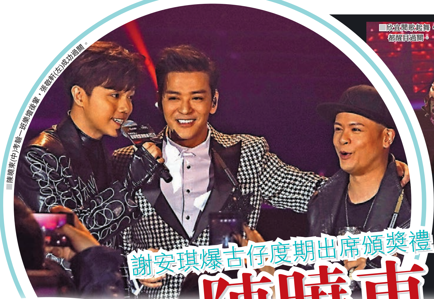
陳曉東(中)考驗一班樂壇後輩，張敬軒(左)成功過關。