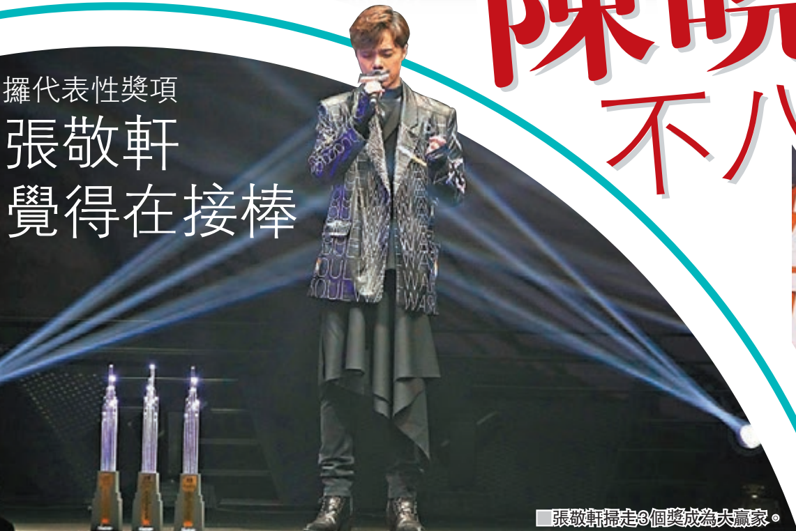
張敬軒掃走3個獎成為大贏家。

張敬軒前晚掃走三個獎成為大贏家，軒仔謙稱是大家「界面」，同時有接棒感覺，因今次取得一些代表性獎項也是他們這代藝人。而軒仔在港台和新城頒獎禮合共奪得6個獎，暫時獨領風騷，他歸功於幕後團隊的功勞，加上今年自己好勤力和幸運。說到他之前和新城合作開音樂會，因而換來多個獎項，軒仔表示：「會有一定友情分，但不一定做完演唱會便多個