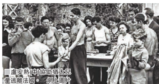
盧安熱(中)協助猶太兒童逃離法國。