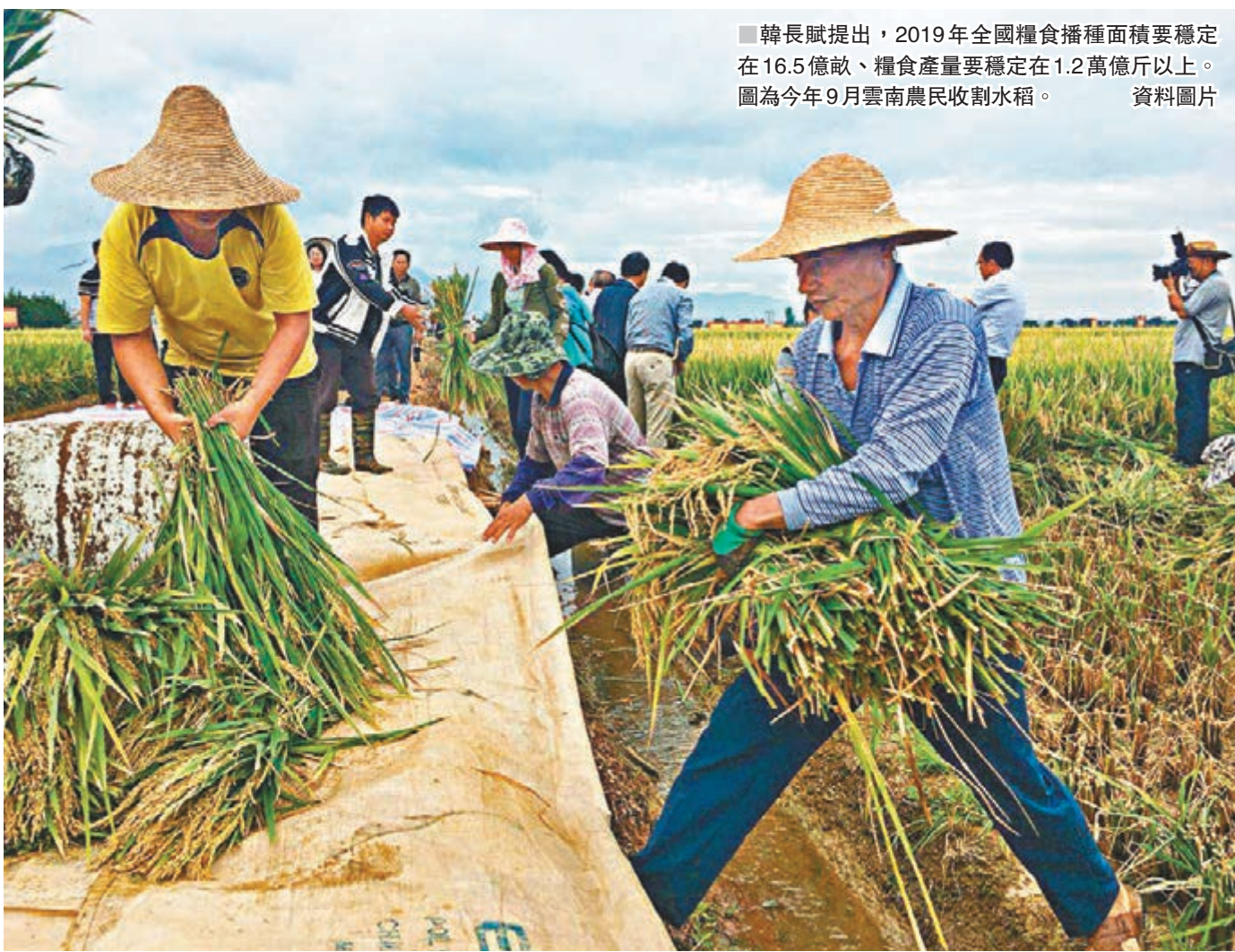
韓長賦提出，2019年全國糧食播種面積要穩定在16.5億畝、糧食產量要穩定在1.2萬億斤以上。圖為今年9月雲南農民收割水稻。資料圖片