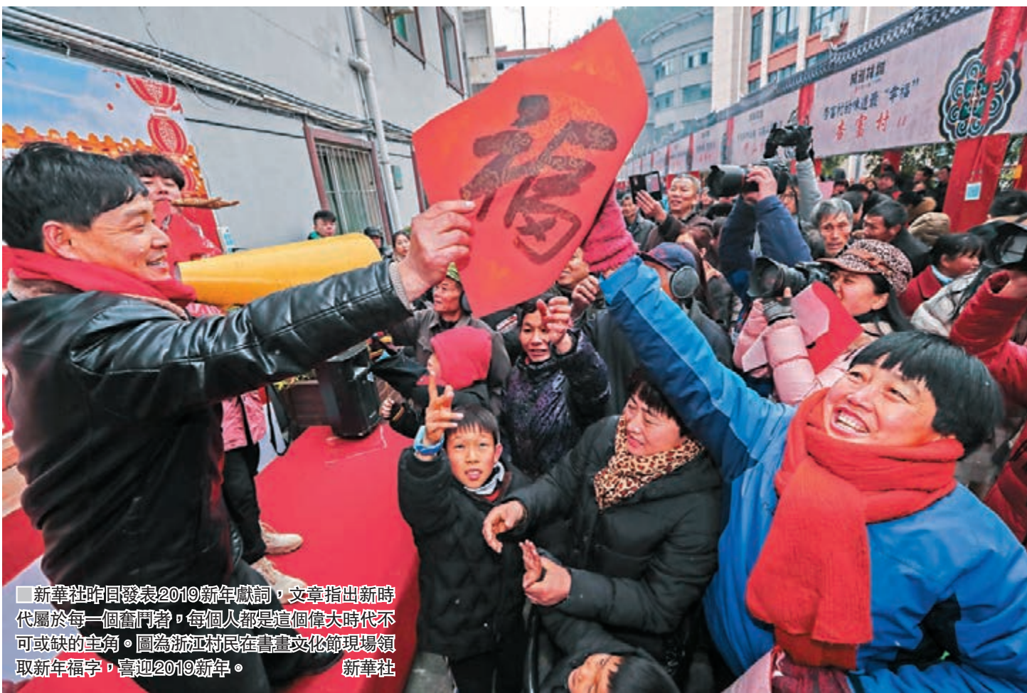
新華社昨日發表2019新年獻詞，文章指出新時代屬於每一個奮鬥者，每個人都是這個偉大時代不可或缺的主角。圖為浙江村民在書畫文化節現場領取新年福字，喜迎2019新年。

新征程上，我們要有敢擔當、善作為的幹勁。我們取得的一切成就，不是天上掉下來的，更不是別人恩賜施捨的，而是億