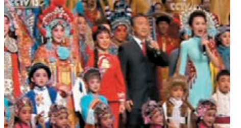
2019新年戲曲晚會在京舉行。視頻截圖

香港文匯報訊 據新華社報道，2019年新年戲曲晚會29日晚在國家大劇院舉行。黨和國家領導人習近平、李克強、栗戰書、汪洋、王滬寧、趙樂際、韓正、王岐山等，與首都近千名群眾一起觀看演出，喜迎新年的到來。