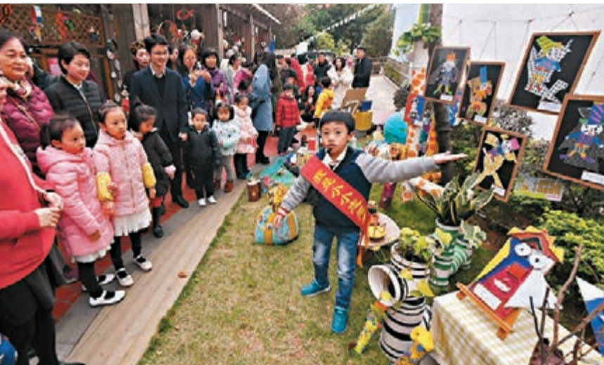
人民日報評論部微信公眾號刊文指出，習近平展望2019年以學習、創新、團結為關鍵詞。圖為福建一名小志願者向家長及小朋友們介紹特色創意作品。

活智慧，到「群之所為事無不成，眾之所舉業無不勝」的治國圭臬，從56個民族多元一體、交織交融的家國歷史，到華夏兒女保衛祖國、抵禦外侮的壯麗史詩，偉大團結精神造就了中華民族團結一心、同心同德的獨特品格。70年前，各民主黨派、無黨派人士和各人民團體、各族各界代表熱烈響應中國共產黨號召，共同努力實現了建立新中國這一中國人民站起來的歷史偉業，靠的同樣是團結。新時代新征程，「人心是最大的政治，共識是奮進的動力」。激發風雨同舟、萬眾一心的團結