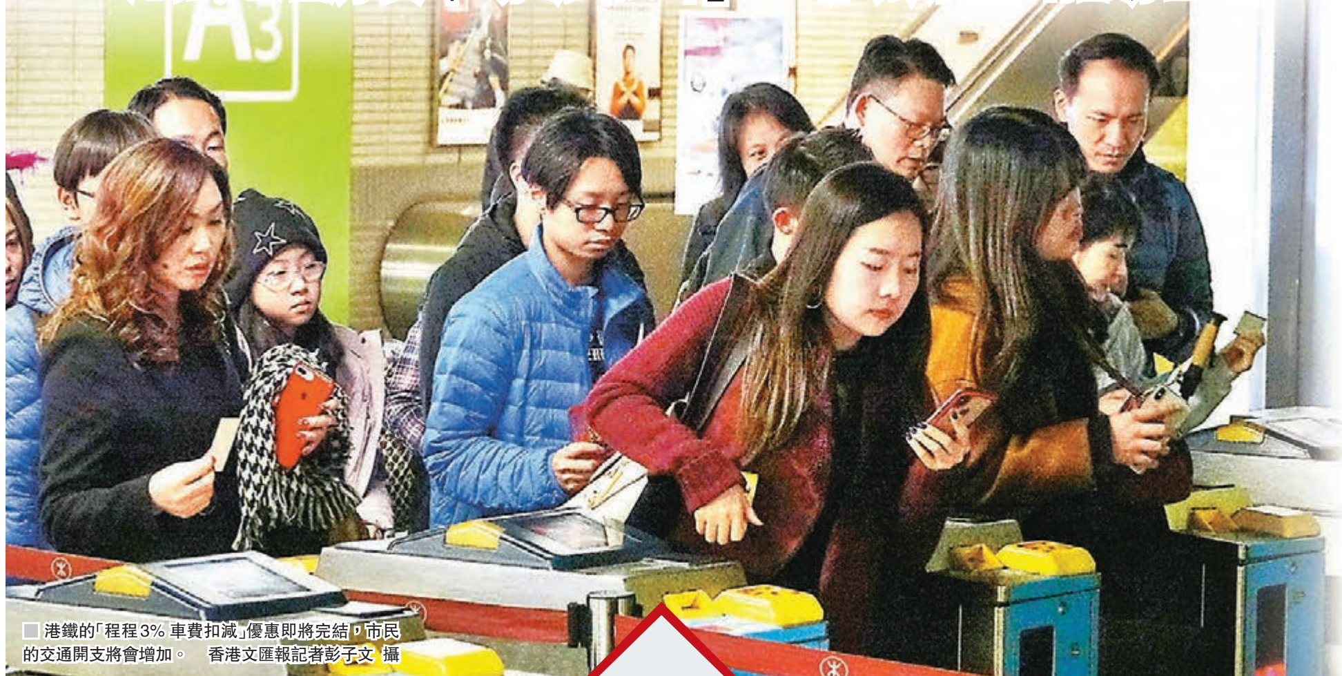
港鐵的「程3%車費扣減」優惠即將完結，市民的交通開支將會增加。