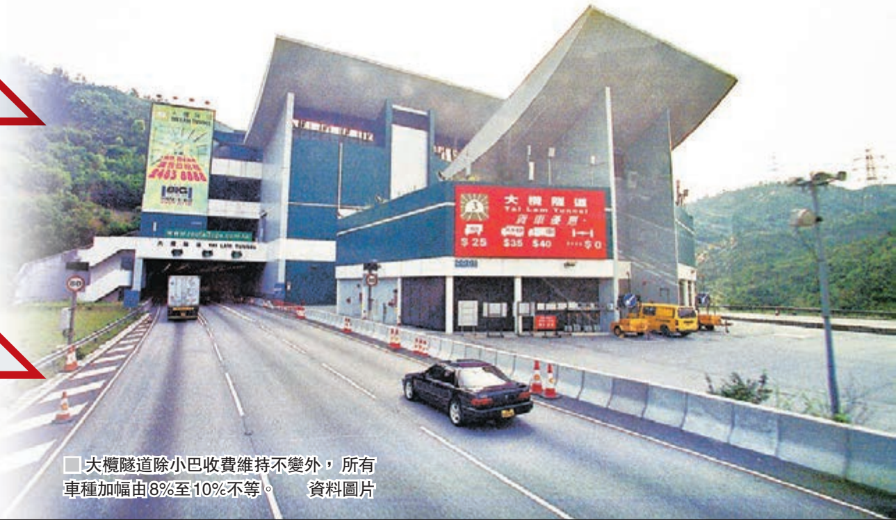
大欖隧道除小巴收費維持不變外，所有車種加幅由8%至10%不等。資料圖片

電費在新一年將加價，媽媽說早上不能開廁所燈，但港鐵加價就沒有辦法應對，因為只得港鐵有提供學生優惠，即使它加價，仍然是最便宜的交通工具，所以也只好繼續乘坐。