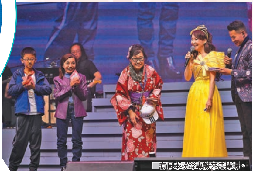
■有日本粉絲專誠來港捧場。