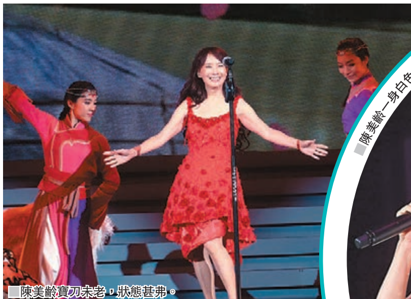
■陳美齡寶刀未老，狀態甚勇。