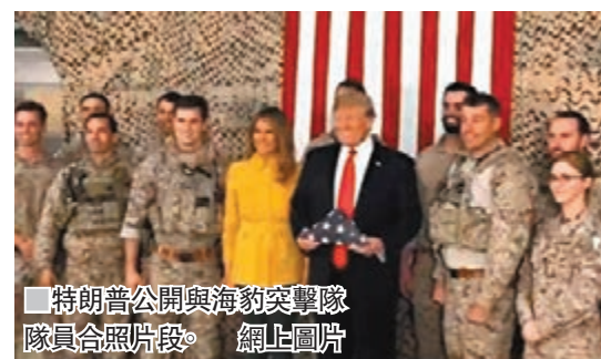
特朗普公開與海豹突擊隊隊員合照片段。

影片中，其中一名士兵向特朗普自報姓名，並表示自己隸屬於海豹突擊隊第5分隊，其身份亦因此向全世界公開。國防部官員指，特朗普身為三軍總司令，有權披露有關資訊，故上載影片不構成違規問題。但報道指出，派駐前線的海豹突擊隊隊員身份和部署位置，一般不會公開，軍方亦通常會在公開照片中將他們的面容作處理。前海軍情報專家南斯指，若影片中的隊員不幸落入恐怖分子手中，隊員將難以藉否認身份來逃脫。 ■綜合報道