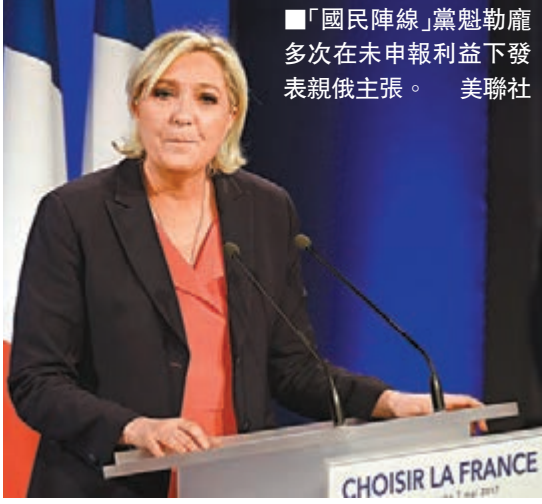
「國民陣線」黨魁勒龐多次在未申報利益下發表親俄主張。

報道指出貸款事件是俄羅斯透過秘密融資，企圖干預外國運作的最佳證據，亦反映俄羅斯企業和官員行事進取，普京只需提出大方向，政府內外的人士便會主動執行。 ■綜合報道