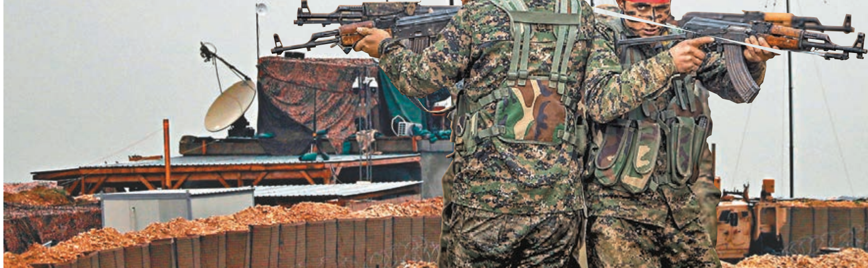
曼比季不再高掛美國旗。

美國總統特朗普上周宣佈從敘利亞撤軍，令獲美軍支持的庫爾德族武裝組織「人民保衛軍」(YPG)頓失保護傘，隨時可能遭到北面虎視眈眈的土耳其揮軍清剿。為了自保，YPG昨日突然提出與敘利亞總統巴沙爾的政府合作，並邀請政府軍進駐庫爾德族控制區內的戰略重鎮曼比季，300名政府軍隨即入城，敘利亞國旗相隔6年後再次在當地升起。目前美軍和法軍仍然駐紮在曼比季，暫時未知這次庫爾德族與政府軍聯手對歐美聯軍戰略有何影響。