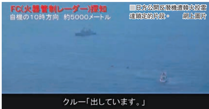
FG(火器管制レーダー)探知 自機の10時方向 約5000メートル