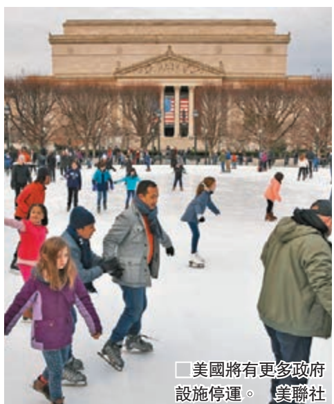
美國將有更多政府設施停運。