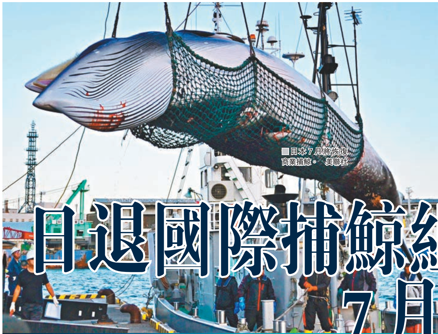
日本7月將恢復商業捕鯨。