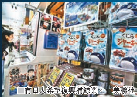
有日人希望復興捕鯨業。

日本政府宣佈退出國際捕鯨委員會(IWC)後，多個捕鯨重鎮的漁民均表示歡迎，不過多個環保組織過往均曾以激烈手段阻撓日本漁民捕鯨，包括以船隻撞擊捕鯨船，令漁民擔心環團的行動可能因日方退出IWC而升級，故對消息憂喜參半。