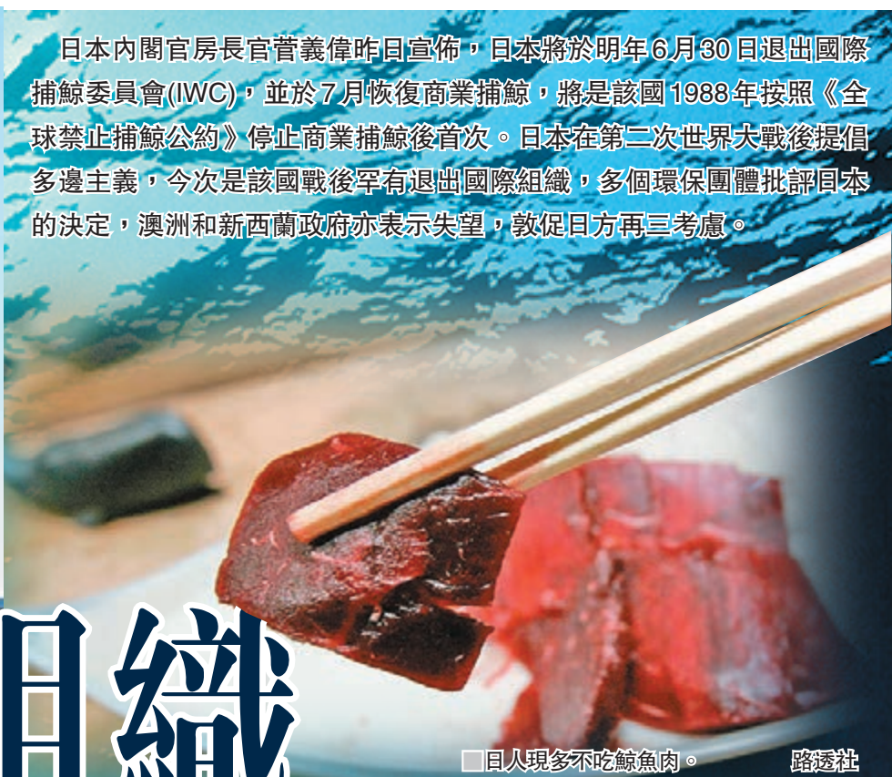
日人現多不吃鯨魚肉。