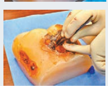
「三維創意仿真傷口模型」，加入會「噴血」和「標膿」隱藏傷口。