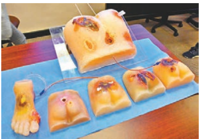
「仿真模型」由2016年開始研發，至今已發展至第四代。