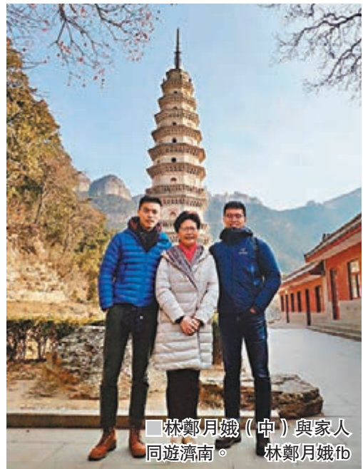
林鄭月娥(中)與家人同遊濟南。

該負責人表示，目前，除「回鄉證」「台胞證」外，居民身份證、港澳台居民居住證、外國人永久居留身份證三種證件，均可實現12306網站聯網核驗。鐵路部門將持續對12306網站的頁面以及註冊、購票流程進行優化，創新服務內容，努力改善旅客購票體驗。