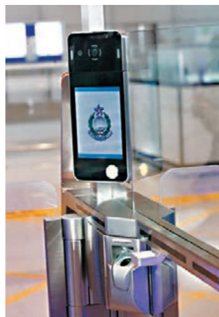
新「e-道」設有鏡頭，但入境處暫不打算引入容貌識別技術核實港人身份。