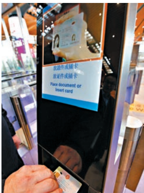
新「e-道」引入光學閱讀器讀取身份證資料，可加快出入境手續時。