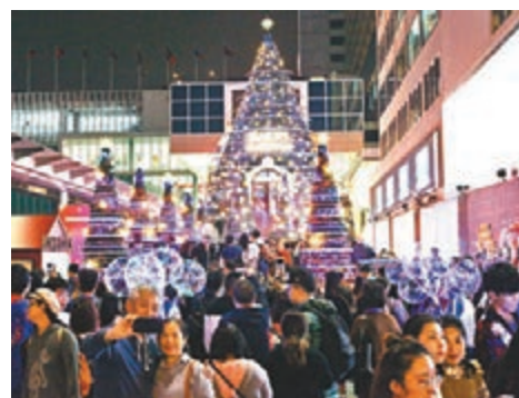
香港中西薈萃。圖為尖沙咀海港城聖誕燈飾。

香港從原來的一個漁村一步步發展成為當今國際金融、貿易、航運中心。香港的魅力與優勢正在於她融匯中西，博取衆長而內化於身。「一國兩制」的制度化設計讓香港的特色與優勢得以延續和發展。回歸21年來，高速發展的國家一直是香港砥礪前行的堅強後盾，而香港也在國家改革開放進程中發揮了重要而獨特的作用。相信，未來香港只要找準自己的方位與支點，繼續發揚「獅子山精神」，抓住國家擴大開放、推進粵港澳大灣區和「一帶一