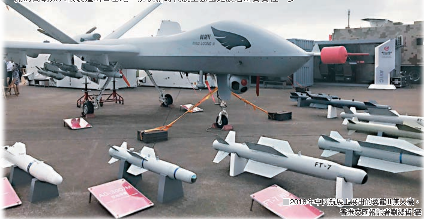
2018年中國航展上展出的翼龍II無人機。

香港文匯報訊(記者 劉凝哲 北京報道)中國無人機領域近期不斷傳出好消息。據中國航空工業集團有限公司消息,「翼龍」系列無人機日前在四川成都實現第100架國際交付,創下中國無人機出口的新紀錄。昨日,被業界認為是無人機「國家隊」的中航(成都)無人機系統股份有限公司,在四川省成都市揭牌成立,這標誌着航空工業在全力打造國內領先、世界一流的高端無人機製造出口基地,加快新時代航空強國建設邁出實質性一步。