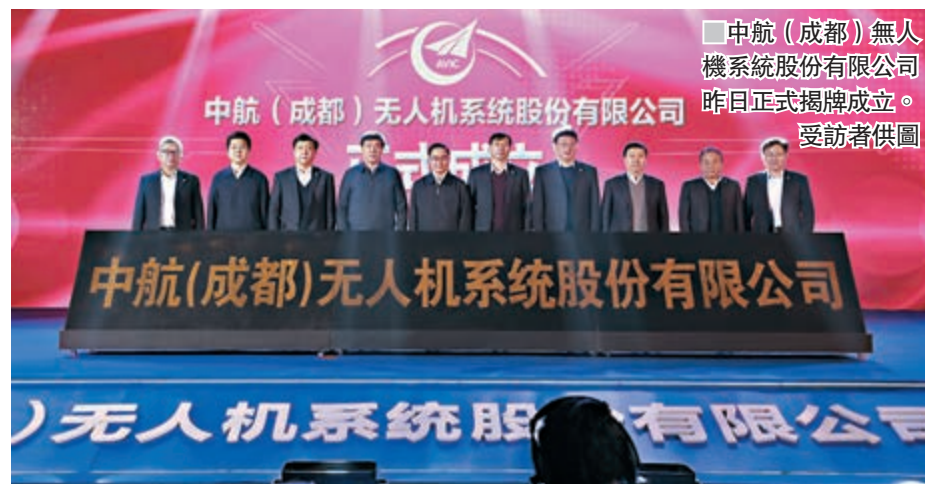
中航(成都)無人機系統股份有限公司昨日正式揭牌成立。