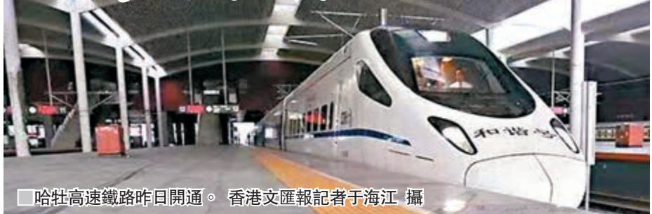
哈牡高速鐵路昨日開通。

香港文匯報訊(記者 于海江 哈爾濱報導)中國《中長期鐵路網規劃》中「八縱八橫」高鐵網最北「一橫」的重要組成——哈牡(哈爾濱至牡丹江)高速鐵路昨日正式開通,兩地最快運行時間1小時28分,與哈齊高鐵路、哈大高鐵路等共同構成黑龍江里程碑式的丁字形鐵路網結構。哈牡高鐵路位於黑龍江省東南部,營業里程300公里,設哈爾濱、新香坊北、阿城北、帽兒山西、尚志南、一面坡北、蕪河