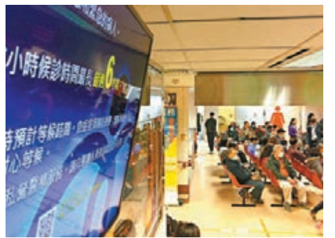
■急症室的候候時間長達8小時。資料圖片