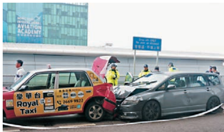
■毒品快餐車失控撞向的士車尾後，車頭毀爛。