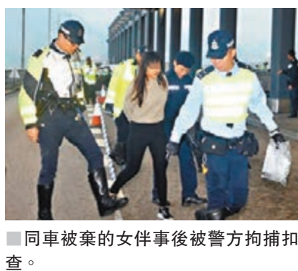
同車被案的女伴事後被警方拘捕扣查。