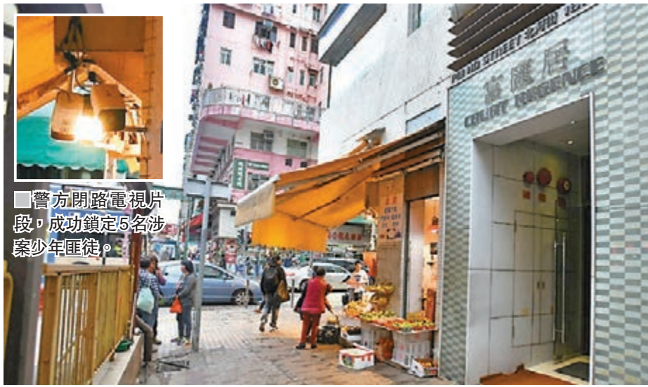
深水埗早前連日發生行劫案及企圖行劫案，警方經調查拘捕6名涉案男女。圖為其中在北河街181號發生的企圖劫案現場附近。

香港文匯報訊(記者 蕭景源、鄧偉明)深水埗揭發非常母親教唆兒子糾眾行劫案件。一名婦人早前與人打麻將敗北後，思疑其中兩名「麻將腳」出千，竟指示兒子糾眾行劫兩「麻將腳」作報復；兒子找來4名同邨朋輩組成「匪幫」，連日到兩名目標出地點埋伏伺機犯案，其中一人被劫8,000多元現金、另一人則未有損失。直至前日平安夜，警方經調查拘捕5名童黨及涉嫌主使犯案婦人帶署。