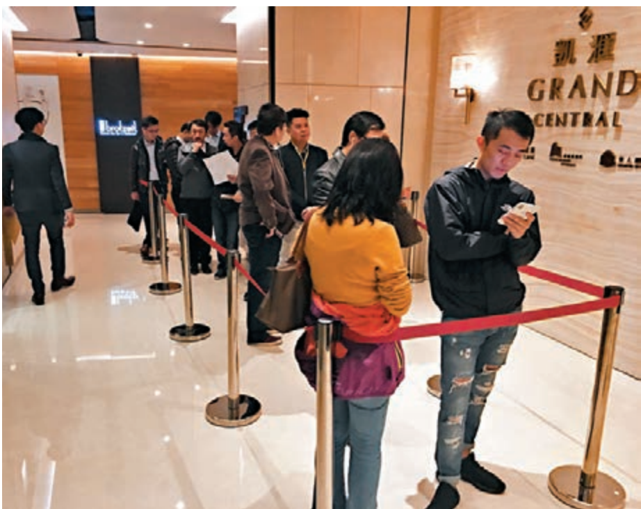
▲凱滙過去三輪銷情理想，圖為市民排隊參觀情況。

凱滙2期日前開賣338伙，並售出約335伙，佔可售單位逾99%。發展商即日加推一張新價單108伙，並輕微加價1%至3%；昨日再原價加推另一張價單100伙，折實平均呎價約19,952元。如果以平均呎價進行比較，新一張價單相比對上一張價單約19,838元高出0.57%。