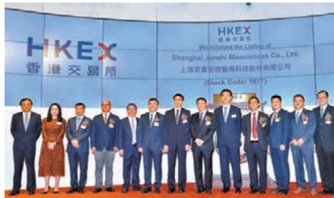
■李小加(左一)強調，新股發行機制改革進行需時，並非馬上便可完成。

香港文匯報訊(記者 股考玲)就2019年新股改革進程，港交所(0388)行政總裁李小加昨出席新股上市儀式後表示，港交所一直有就新股制度進行改革，同時檢視市場規劃及結構，他預期明年2月底會公佈3年的戰略計劃，屆時會有更清晰路線圖，會集中於與資產類別的規劃，以及加強與內地及全球互聯互通。 李小加強調，新股發行機制改革進行需時，並非馬上便可完成。他又指，本港未來要加強金融科技的發展，不能落後於其他市場。此外，李小加表示新股制度進行改革，不是因為市場出現問題，而證監會早前建議港交所檢討新股發行機制，也不是對港交所所有具體不滿，他相信證監會只是強調港交所審批新股的責任重大而已。