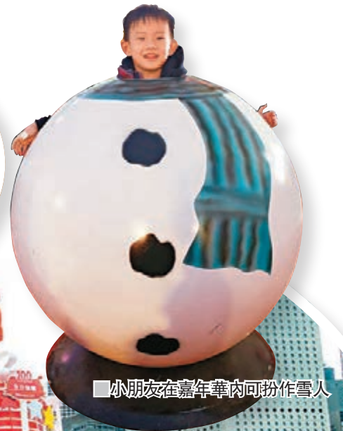
小朋友在嘉年華肉肉扮作雪人