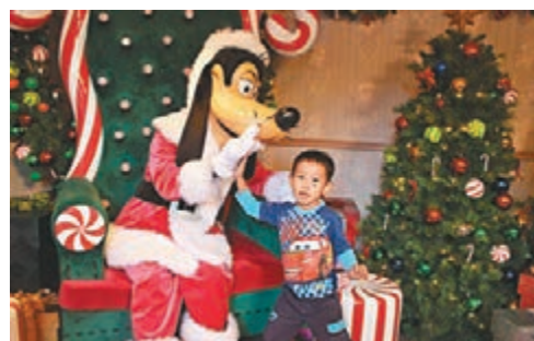
高飛會化身為聖誕老人，在會客室同大家見面影親相。

想過白色聖誕，不用去歐美那麼遠，香港迪士尼由即日起為樂園添上璀璨奪目的聖誕氣氛。今個聖誕，隨著皚皚白雪降臨，奇妙的聖誕魔力點亮整個樂園。大家與摯愛和好友親臨已幻化成冬日雪國的樂園，跟一眾迪士尼朋友歡度溫馨難忘的時光，日夜感受「A Disney Christmas」與別不同的聖誕驚喜，如欣賞全新18米高色彩斑斕的聖誕樹、美輪美奐的聖誕裝飾、閃爍亮麗的燈飾及萬眾期待的飄雪。今年，樂園首次舉辦「夢想花園冬日市集」，以及在「聖誕飄雪時刻」欣賞漫天飛雪等。你最喜愛的迪士尼朋友，包括首次參加聖誕慶祝活動的Duffy最新好友Cookie，亦會和大家一同分享喜悅，共度奇妙聖誕。加上，今年是米奇90歲生日，樂園亦大搞雙重慶祝活動，香港居民尊享高達8折「奇妙處處通」多買多送優惠，由即日起至明年1月1日，賓客可在這期間參與「米奇90派對盛事」，更可和一班「米奇與好友」開聖誕舞會，在音樂下一同載歌載舞，齊齊慶祝米奇老鼠90周年。