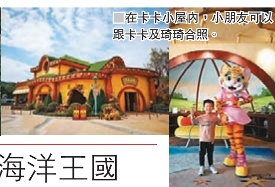
在卡卡小屋內，小朋友可以跟卡卡及琦琦合照。