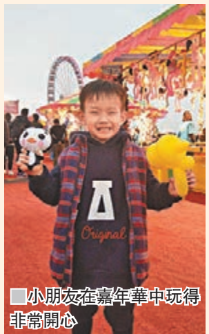
小朋友在嘉年華中玩得非常開心