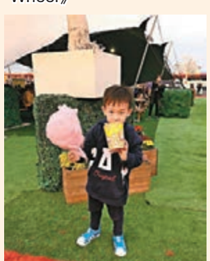
今年場內設有深受小朋友喜愛的爆谷和棉花糖。