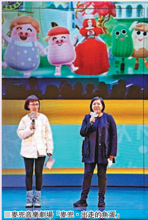
麥兜音樂劇場「麥兜·出走的魚蛋」

同時，多間榮獲米芝蓮星級推介的本地特色食店進駐香港老大街，多位懷舊經典人物，如馬姐、女殺手、筷子姊妹花等現身，重現昔日香港節慶情景，讓遊人與摯愛恍如穿梭時空，過一個獨特難忘的聖誕佳節。