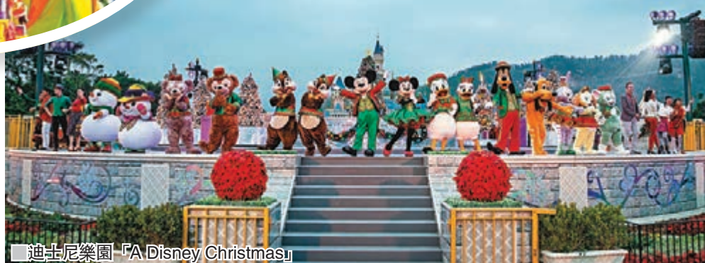
迪士尼樂園「A Disney Christmas」

想過白色聖誕，不用去歐美那麼遠，香港迪士尼由即日起為樂園添上璀璨奪目的聖誕氣氛。今個聖誕，隨著皚皚白雪降臨，奇妙的聖誕魔力點亮整個樂園。大家與摯愛和好友親臨已幻化成冬日雪國的樂園，跟一眾迪士尼朋友歡度溫馨難忘的時光，日夜感受「A Disney Christmas」與別不同的聖誕驚喜，如欣賞全新18米高色彩斑斕的聖誕樹、美輪美奐的聖誕裝飾、閃爍亮麗的燈飾及萬眾期待的飄雪。今年，樂園首次舉辦「夢想花園冬日市集」，以及在「聖誕飄雪時刻」欣賞漫天飛雪等。你最喜愛的迪士尼朋友，包括首次參加聖誕慶祝活動的Duffy最新好友Cookie，亦會和大家一同分享喜悅，共度奇妙聖誕。加上，今年是米奇90歲生日，樂園亦大搞雙重慶祝活動，香港居民尊享高達8折「奇妙處處通」多買多送優惠，由即日起至明年1月1日，賓客可在這期間參與「米奇90派對盛事」，更可和一班「米奇與好友」開聖誕舞會，在音樂下一同載歌載舞，齊齊慶祝米奇老鼠90周年。