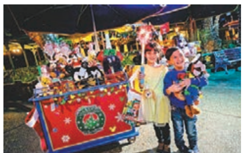
夢想花園冬日市集