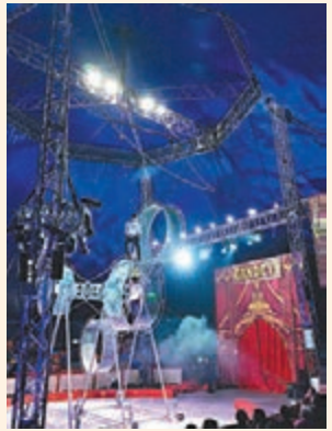
《Double Giant Space Wheel》