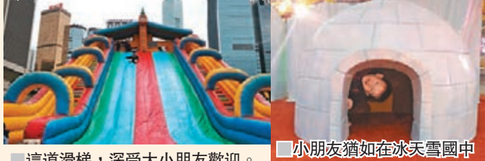
這道滑梯，深受大小朋友歡迎。小朋友猶如在冰天雪國中

《The Rubber Man》、《A Cloud Swing》、《The London Showgirls》及《Double Giant Space Wheel》等。