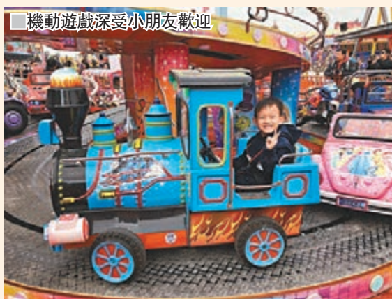
機動遊戲深受小朋友歡迎