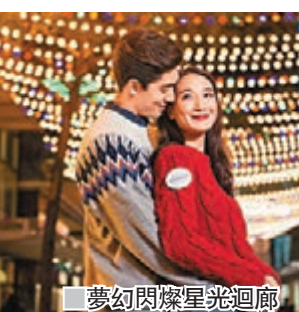
夢幻閃爍星光迴廊

而且，利園區今年更首度夥拍慈善機構「點滴是生命」推廣「佳節獻祝福」計劃，大家只要在利園二期及三期之兒童服裝及生活用品商戶購物惠顧滿HK$500或以上，即可以換領精美聖誕雪花掛飾禮盒乙個，而利園區更會以每換領一盒雪花掛飾捐出HK$50資助「點滴是生命」在貧瘠地區建設淨水設施。