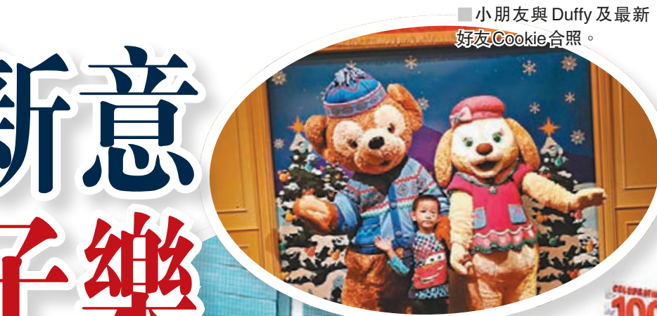
小朋友與Duffy及最新好友Cookie合照。