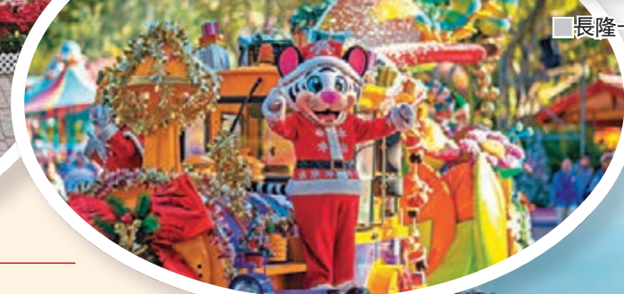
長隆卡卡換上聖誕服裝巡遊