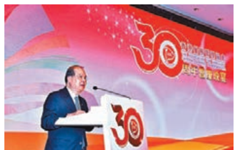
張建宗指，餐飲業必須不斷自我增值，以維持「美食天堂」美譽。

年底是飲食業旺季，政務司司長張建宗表示，2018年的上半年食肆總收益為593億元，按年上升8.4%，而現時有約24.6萬人從事餐飲業膳食服務業，佔本地就業人口約7%。他指餐飲業必須不斷自我增值，以維持「美食天堂」的美譽，政府亦會致力鼓勵餐飲業推動創新科技，採用創新意念，提升服務水平及管理運作。