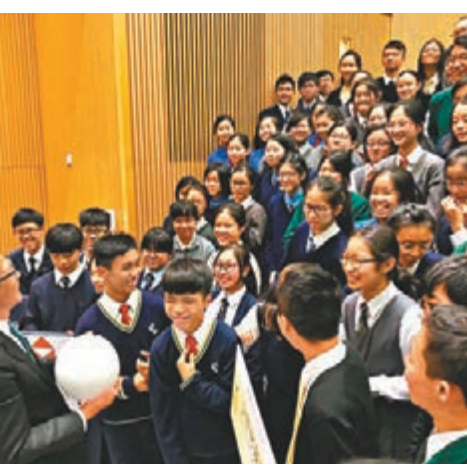
陳茂波早前與約100名中學生交流對財政預算案的想法。