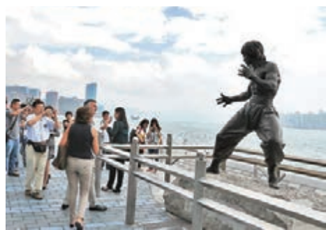
香港的魅力來自於軟實力。圖為星光大道李小龍雕塑吸引海內外遊客。

其實自古以來，但凡一個國家或地區文化昌盛，先決條件就是政治清明、經濟活躍、社會穩定，只需內無隱憂、外無禍患，人民安居樂業後就必然將精神力訴諸於文化的繁榮，再通過官方的扶持和引導，就能自然而然地發出強大的軟實力，如同漢唐文化、日韓文化的潮流一般風靡於世。也正因為看到了香港人民對軟實力的訴求，保持香港經濟社會繁榮穩定，才會是一以貫之的施政方針。以香港人的智慧和能力，加之對於自身文化的積澱和傳承，只要凝心聚力，不多折