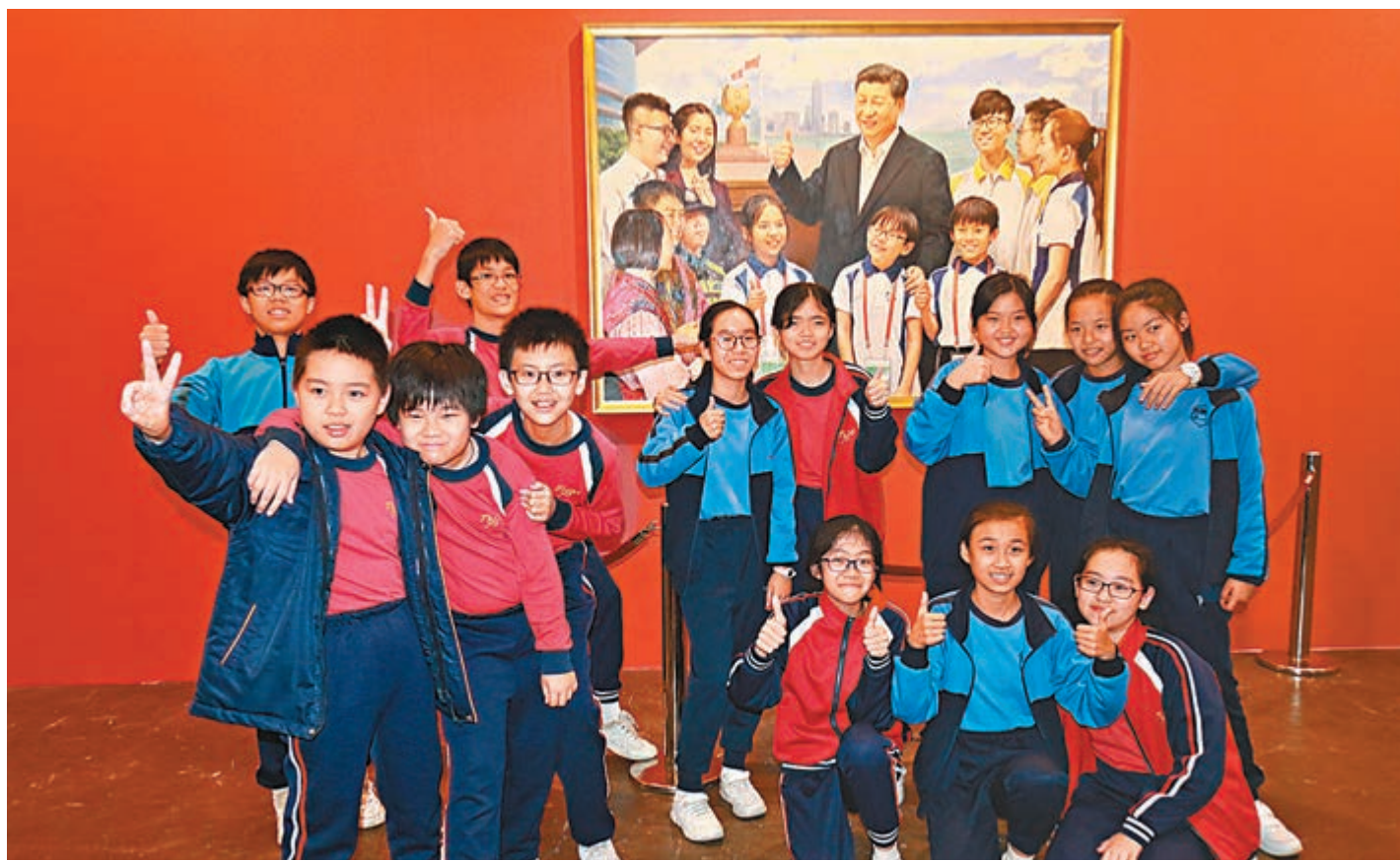
學生觀賞畫作《習主席與香港青少年在一起》，大家都興奮不已。