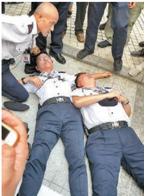
在10月1日的遊行中，有3名保安被示威者衝擊倒地，其中兩人昏迷，均需送院治理。

他指出，民陣聲言不認同「港獨」，卻考慮提出司法覆核，再次顯示反對派包庇、縱容「港獨」，強調「港獨」破壞國家主權及領土完整、破壞「一國兩制」，應該旗幟鮮明的去反對，「他們只是說不支持、不認同『港獨』，卻不明言反對，又處處維護，只是為『港獨』鳴鑼開道，他們應該站在大多數市民的一邊，他們可