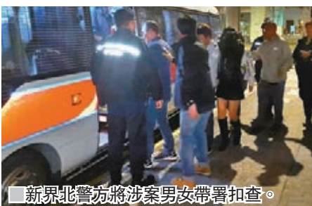
■新界北警方將涉案男女帶署扣查。

具;在涉無牌酒吧案中檢獲約900支啤酒、及約470罐啤酒,總值約1.6萬元。另檢走一套卡拉OK設備。