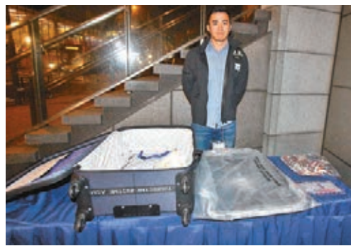
■警方展示在行李篋內檢獲的海洛英毒品。

香港文匯報訊(記者 蕭景源)4人疑為「搵快錢」,淪為毒品集團販毒工具。其中一名越南籍女子報稱替人運送行李篋,在屯門天后路被警方毒品調查科截查,揭發篋內暗藏市值約510萬元的海洛英毒品,警方正調查她是否知悉篋內藏有毒品。