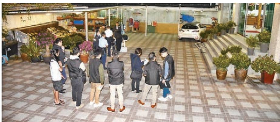
■大埔坑下莆村前晚發生夫斬妻血案,大批警員趕至進行調查。

階段,反映關係已非常緊張,如果雙方需要處理資產分配這些敏感問題,應小心注意安全問題。