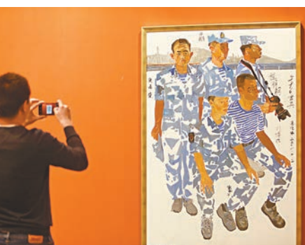
市民拍攝畫作留念。