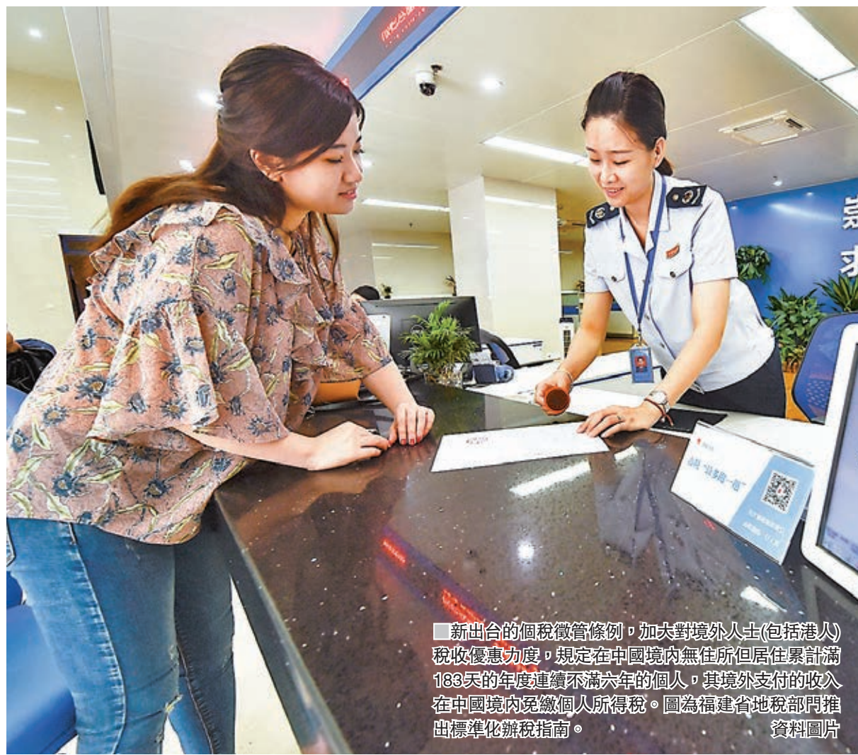
■新出台的個稅徵管條例,加大對境外人士(包括港人)稅收優惠力度,規定在中國境內無住所但居住累計滿183天的年度連續不滿六年的個人,其境外收入在中國境內免繳個人所得稅。圖為福建省地稅部門推出標準化辦稅指南。

香港文匯報訊(記者 海巖 北京報道)國務院總理李克強昨日簽署國務院令,公佈修訂後的《中華人民共和國個人所得稅法實施條例》(以下簡稱「個稅法實施條例」),自2019年1月1日起與新個人所得稅法同步施行。新出台的個稅徵管條例,加大對境外人士稅收優惠力度,規定在中國境內無住所但居住累計滿183天的年度連續不滿六年的個人,其境外收入在中國境內免繳個人所得稅。業內分析,這意味著,包括港人在內的所有境外人士享受「個稅豁免」政策年限,將從五年延長至六年,大部分在華工作的境外人士利用「六年豁免」規則,可使大部分境外收入豁免繳納中國的個人所得稅。此舉回應了社會呼聲,凸顯中國經濟發展新階段吸引國際人才來華、支持國家科技創新的政策導向。