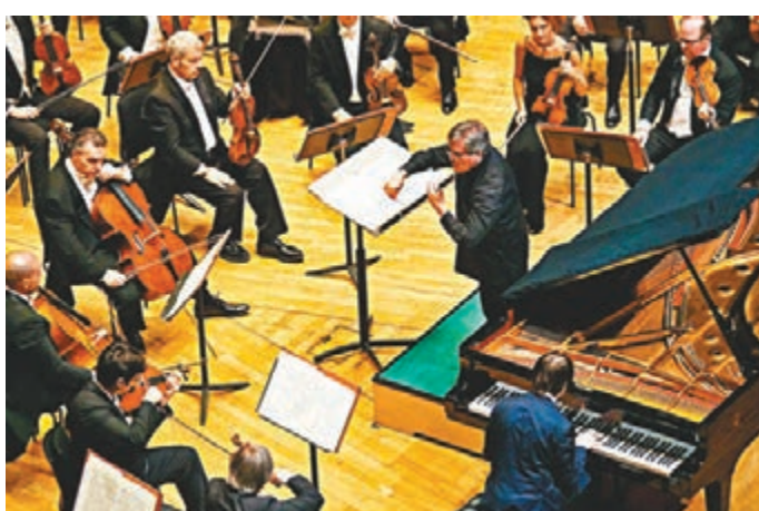
鋼琴家 Daniil Trifonov 與羅馬聖切契利亞管弦樂團在香港演出。