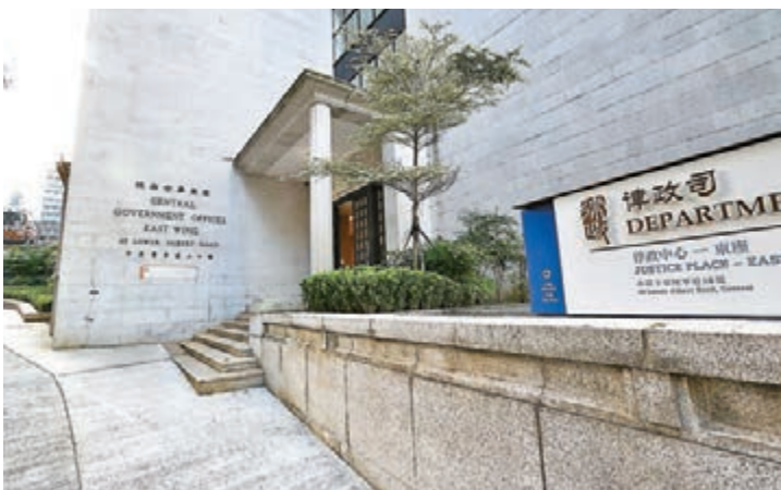
法律界人士指大律師公會的聲明，是公然干預律政司的獨立檢控權。圖為律政中心。

因此，律政司是否尋求外聘獨立法律意見，應由律政司因應證據的強弱、案件複雜程度、有否有利益衝突等因素作出決定。