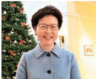
林鄭月娥拍片預祝市民聖誕快樂。

下個禮拜二就係聖誕節，唔少香港市民都會選擇出外旅遊，感受節日氣氛。行政長官林鄭月娥昨日嘍由上親自拍片，預祝各位聖誕快樂，亦希望大家新年身體健康，家庭幸福快樂。