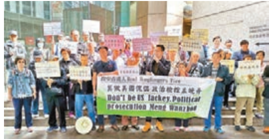
「政中港人」要求加拿大政府釋放孟晚舟。

香港文匯報訊（記者馬壯）華為副董事長兼首席財務官孟晚舟早前被加拿大拘押。團體「政中港人」昨日抗議加拿大無理拘押孟晚舟，並要求加拿大政府立即無條件釋放孟晚舟。