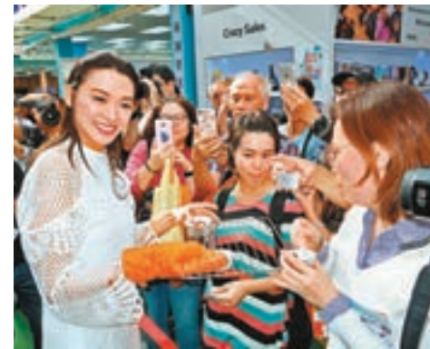
煒哥同支持者互餵,十分Sweet。

喜愛煮東西,不會生厭。」但說到做飲食生意,煒哥要手擰頭,自嘲是個買鼓油送雞的人,肯定蝕死,這方面仍需跟朋友學習,或者要有合夥人,但她不排除會與飲食集團合作推出個人品牌的產品,但仍在初步洽商階段。