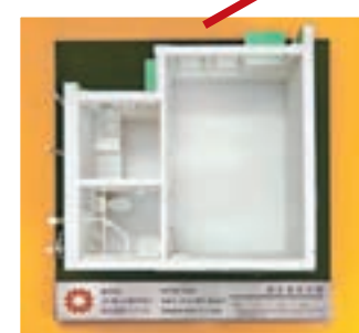
麗翠苑1座1樓至39樓5號單位模型。