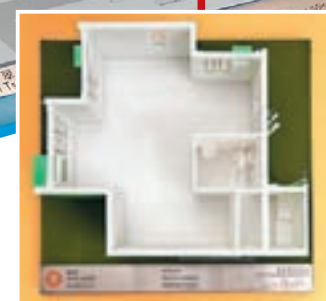
麗翠苑3座1樓至34樓1號單位模型。