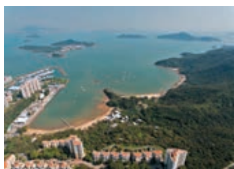
政府擬於喜靈洲及交椅洲附近海域建造人工島。

回條例取得棕地及農地發展的可行性,「廣深港高鐵工程遷拆菜園村引起連串風波,反映收地需要較長時間,遇到較多困難。收地發展之模式涉及眾多不明朗因素,例如引發司法覆核,補償費用及妥善安置的爭拗等,實難以掌握收地所需時間。」不過,該會亦強調「明日大嶼」計劃不能取代其他土地選項,強調政府應以多管齊下方式增加土地供應。