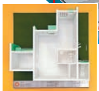
麗翠苑2座19樓至36樓12號單位模型。