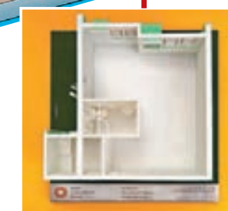
麗翠苑4座1樓至39樓4號單位模型。

有在「出售居者有其屋計劃單位2018」(「居屋2018」)下有效但未能成功購買居屋單位的綠表申請者,只要他們仍然符合「綠置居2018」的申請資格,他們毋須就「綠置居2018」重新遞交申請和繳付申請費。房委會將向這些「居屋2018」綠表申請者寄出信件,通知他們新安排的詳情。