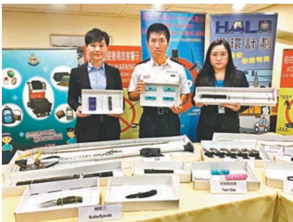
警方呼籲市民提防「機艙老鼠」,小心看管財物。

此外,今年首11個月機場罪案數字為642宗,當中逾半涉及攜帶電槍、伸縮警棍等違禁品,共有339宗。最常見的違禁品為伸縮警棍,今年旅客非法持有伸縮警棍的案件達154宗,較去年的89宗大增73%。