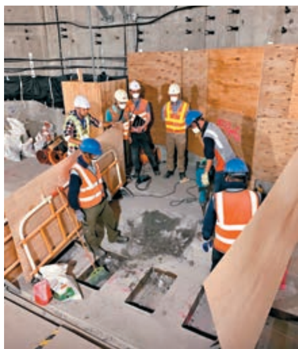
港鐵表示,已檢測的3支鋼筋螺絲帽,並未發現鋼筋被剪短。

運輸及房屋局證實,港鐵沙中線—紅磡站月台層板位置開鑿後鋼筋初步檢視,3支鋼筋螺絲帽均外露超過兩個扭紋,不符標準。港鐵回應指,進行檢測的3個螺絲帽,並未發現鋼筋被剪短情況。有資深土木工程師認為,扭紋外露超出標準或會影響拉力,惟能否影響月台負重則暫時未能下定論。