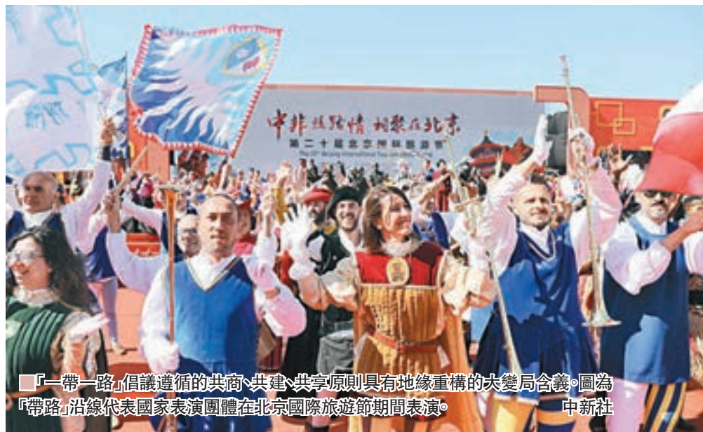
「一帶一路」倡議遵循的共商、共建、共享原則具有地緣重構的大變局含義。圖為「帶路」沿線代表國家表演團體在北京國際旅遊節期間表演。

他指出，中國要做思想引領者，需要一個開放的思想環境，不僅要自己走出去，也要人家能進來，讓思想、文化進行雙向、多向交流，只有這樣，才能在交往中提升影響力。顯然，百年變局中的中國、中國與百年變局，這兩個大課題都值得深度思考。