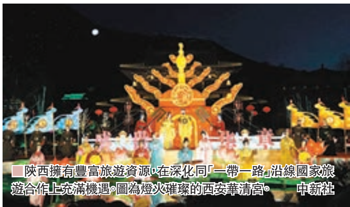
陝西擁有豐富旅遊資源，在深化同「一帶一路」沿線國家旅遊合作上充滿機遇。圖為燈火璀璨的西安華清宮。

重信守諾，提高旅遊風險應對處置能力；要創新發展，注重質量，準確把握當前國際旅遊發展新趨勢以及「一帶一路」旅遊新需求，推動旅遊業轉型升級，滿足遊客「吃住行遊購娛」多樣化需求；要履行社會責任，維護國家形象，通過旅遊交流合作廣交朋友，為促進「一帶一路」沿線國家民心相通作出積極貢獻。