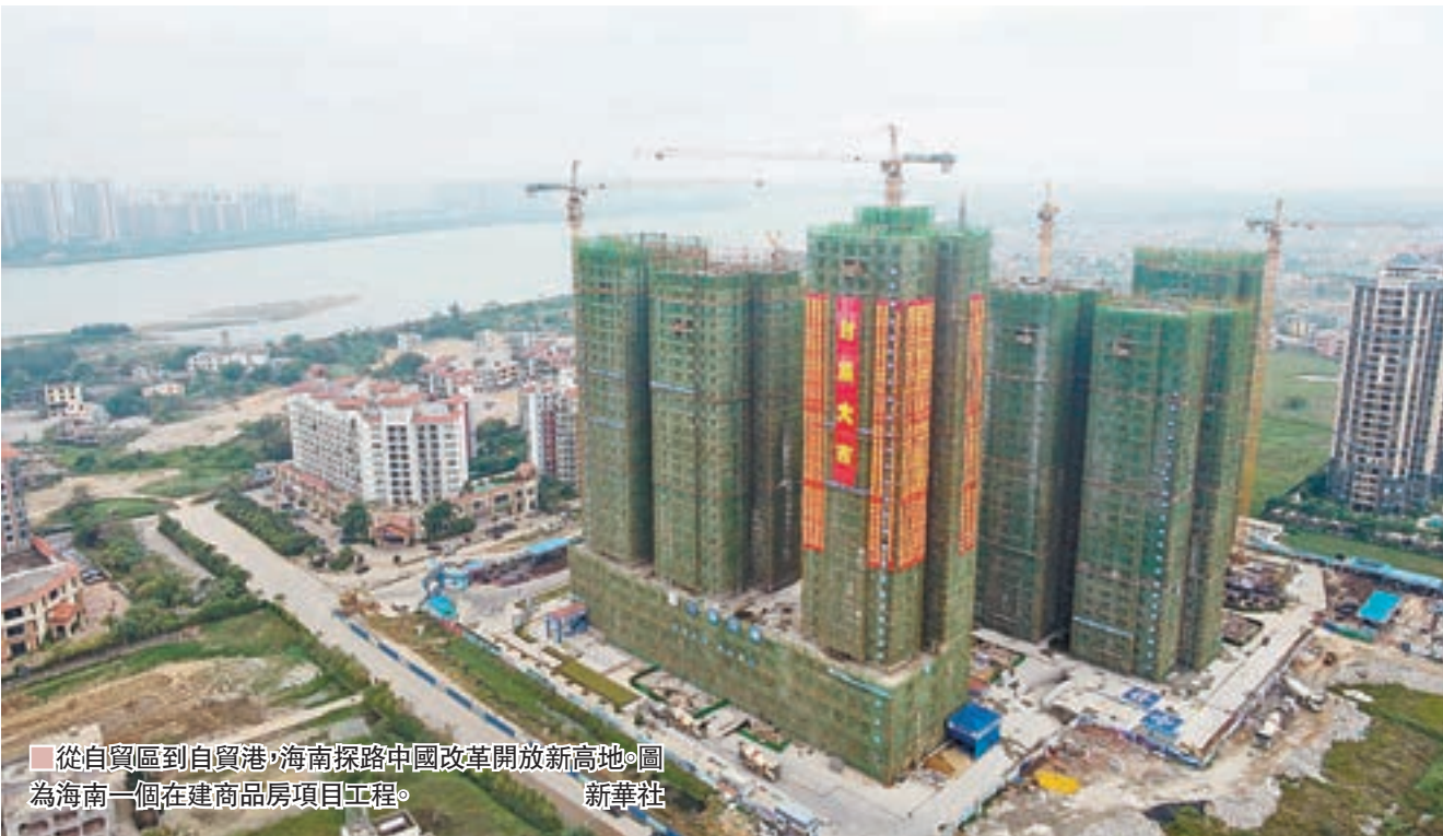
從自貿區到自貿港，海南探路中國改革開放新高地。圖為海南一個在建商品房項目工程。

此外，2018年全國政協外事委員會還聚焦「深化同『一帶一路』沿線國家旅遊合作」、「中歐班列運行情況」和「探索建設自由貿易港」等多個事關中國外交經貿的領域進行了專題調研考察。